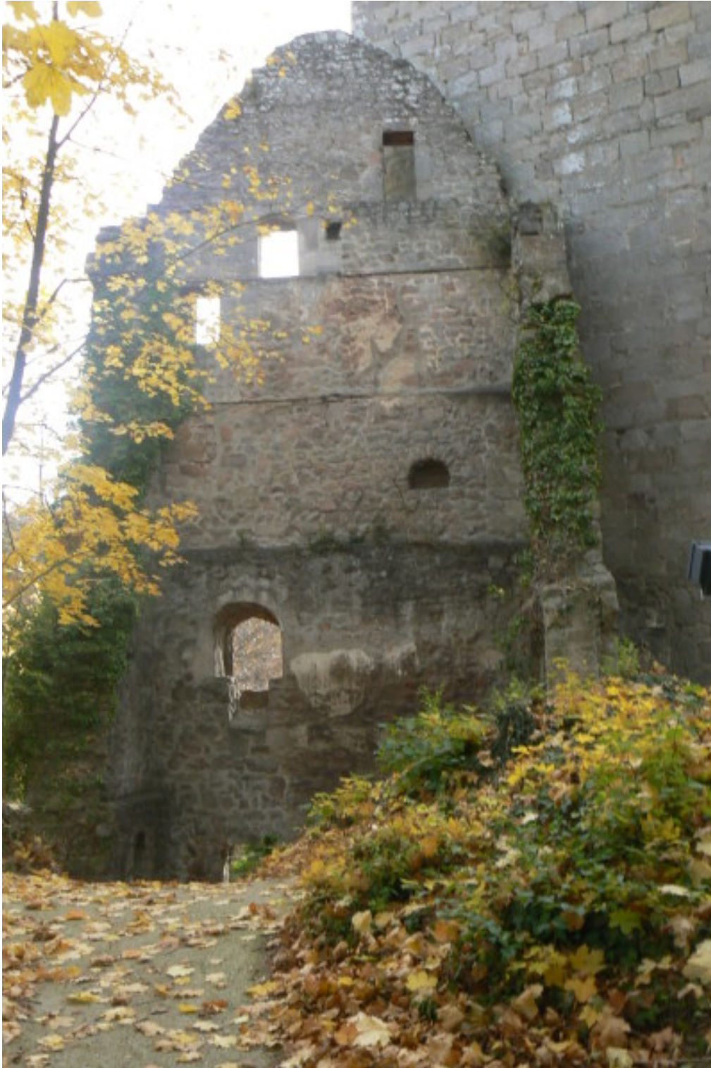
Giebel des Ostpalas

Der Ostpalas grenzt an den zweiten Bergfried. Diesen fünfgeschossigen Turm mit einer Höhe von 27,6 Metern und einer Kantenlänge von 9,6 auf 9,8 Metern und Mauerdicken zwischen 2,5 bis 3 Metern kann man als Wohnturm betrachten. Seine Ausmaße sind enorm und boten genug Fläche, um dort drinnen zu leben.