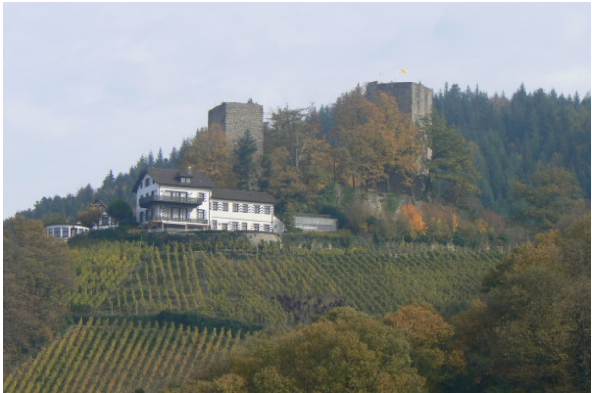
Südseite der Burgruine

Eine Burg mit Hotel- dem Pauschaltouristen fällt dabei der Begriff „Hotelburg“ ein. Doch vom Wortspiel wechseln wir hoch über die Rheinebene, wo sich als Ausläufer des Nordschwarzwaldes der 595 Meter hohe, bewaldete Buchkopf erhebt. Auf einem nach Westen verlaufenden Bergsporn wachen dort zwei Ruinentürme über das weinrebenbewachsene Umland. Burgruine Alt Windeck- auch Windeck genannt- verbreitet hier neben dem Hotel in der Unterburg ein romantisches Flair.