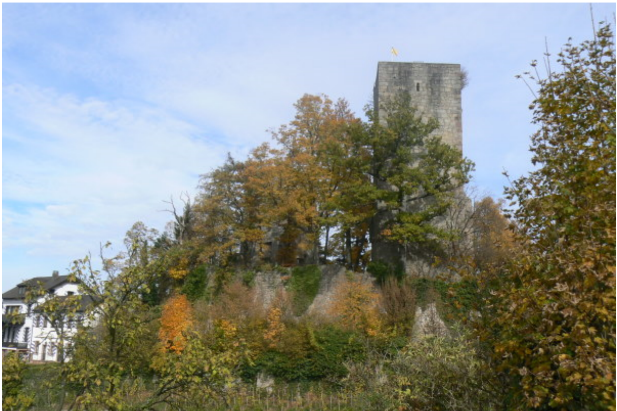
Südseite (links Untere Burg, in der Mitte beide Türme)

überwachen den Zugang über den nördlichen Zwinger, welcher in den Hof der unteren Burg führt. Hier stehen einige neuzeitliche Gebäude, u.a. ein Hotel und ein Restaurant. Die äußere Zwingermauer um die Gebäude, welche das Burgareal begrenzt, umgibt heute noch die gesamte Burg. Von der Westseite führt ein schmaler Zugang hoch in die Kernburg, deren Ringmauer teilweise noch vorhanden ist. Heute betritt man hier das von Bäumen bewachsene Areal einer der zwei Kernburgen (oben gelb markiert).