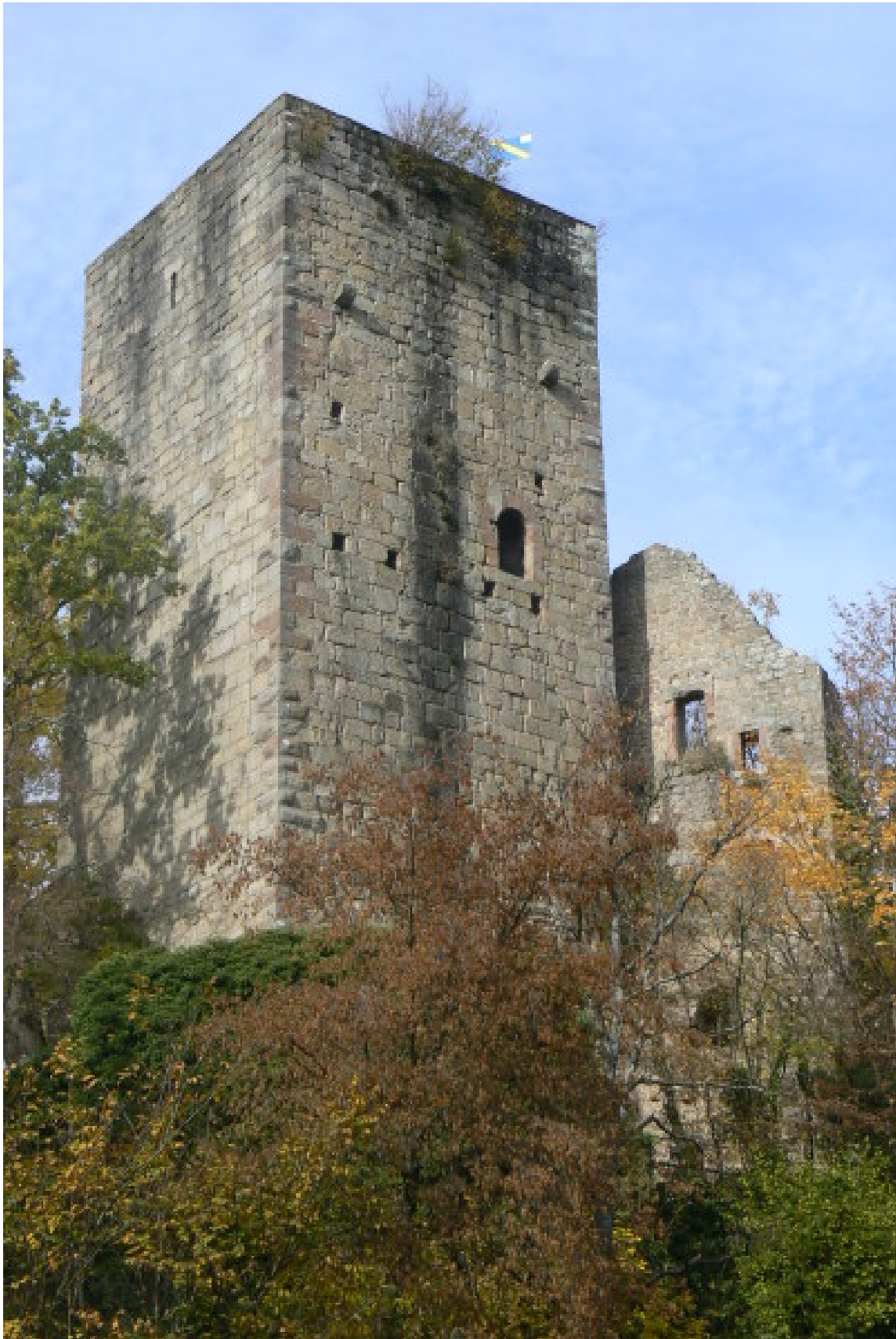
Ostseite des Ostturmes mit Eingang