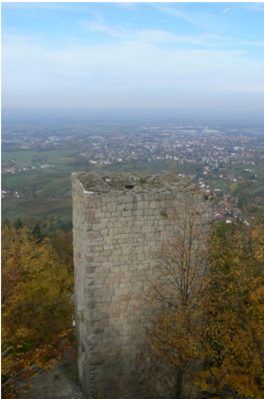
Blick vom Ostturm über den niedrigeren Westturm in die Rheinebene

Ende des 13. Jahrhunderts bildeten sich zwei Familienzweige, von denen einer um 1300 die südlicher gelegene Burg Neu Windeck erbaute.