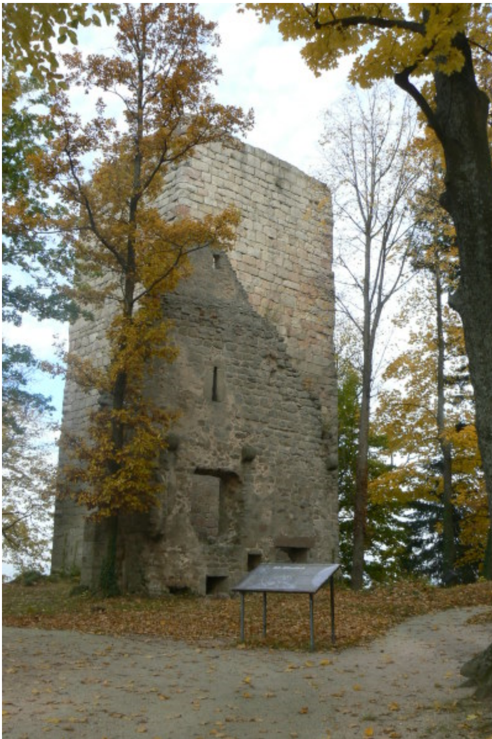
Giebel des Westpalas und westlicher Turm

Nur die Giebelwand des Westpalas zeigt noch die Position der einstigen Trennmauer. Die zweite Ganerben-Kernburg (im Plan oben grün) ist wesentlich größer. Die Giebel des einst vierstöckigen Westpalas, sowie des Ostpalas, sind noch vorhanden.