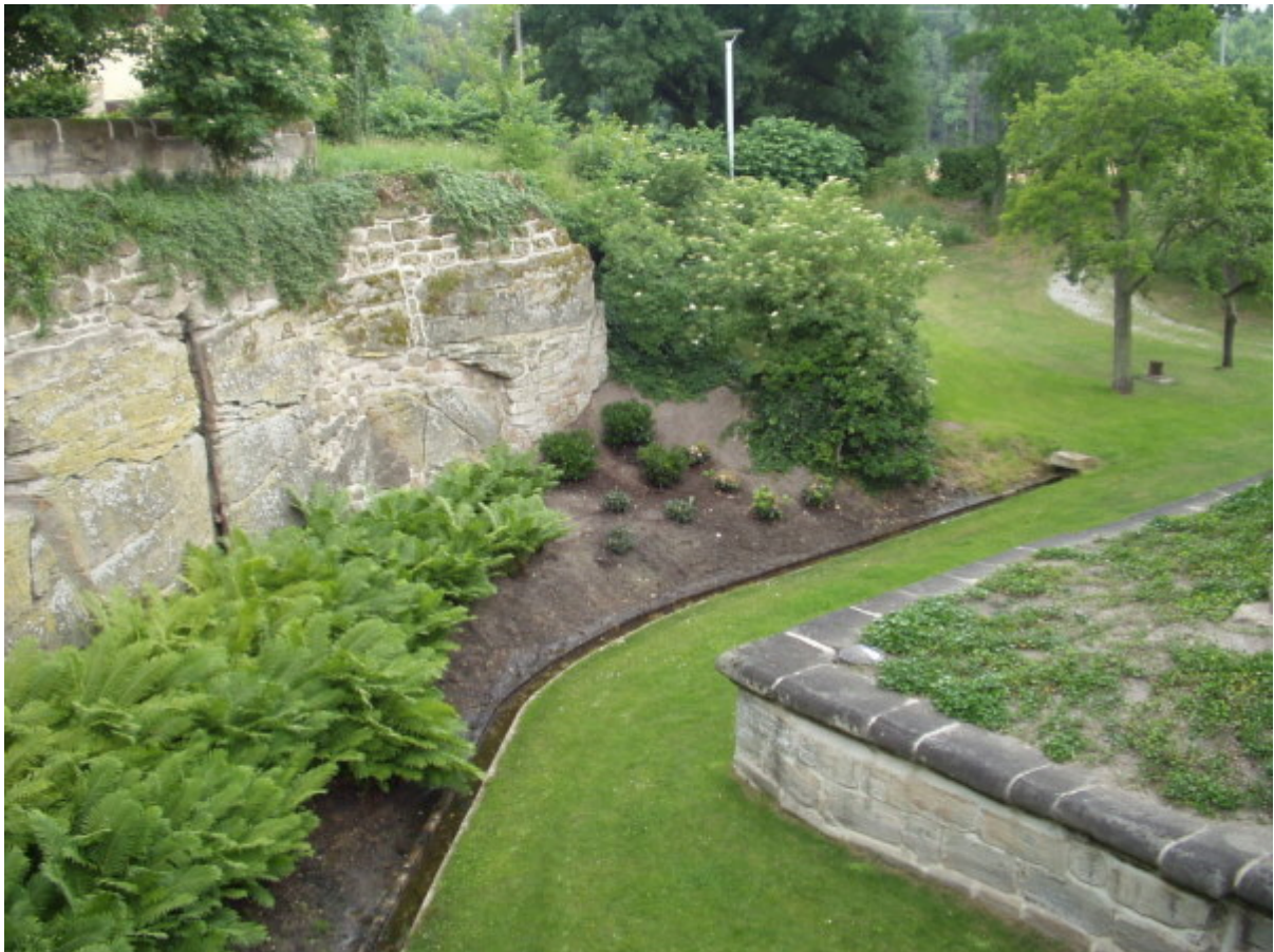
Südwestecke des Grabens mit ehemaligem Zufluss, rechts Sockelfundament

Das Hauptgebäude wird von einem sockelartigen rechteckigen Fundament mit flachen Stützmauern auf der Berme 6 umgeben. Einige Fundamentsteine weisen Zangenlöcher auf, welche eine vorsichtige Datierung des Steinmaterial ermöglichen. 7 Die so genannte Hebezange wurde zum Transport von Steinquadern im Burgenbau ab ca. 1220-30 in ausschließlich benutzt. Da nicht alle der Steinquader mit geregelter Glattfläche oder teilweise grob abgespitzten Quaderbossen die typischen Zangenlöcher aufweisen, ist es möglich das bei einem Wiederaufbau/ Umbau in späteren Jahrhunderten altes Baumaterial für das Fundament verwendet wurde. Auf der Ostseite neben dem Schlossgraben befindet sich ein kleiner ummauerter, barocker Schlossgarten. Südlich gegenüber dem Tor, zu dem eine Steinbrücke führt, ist die „Vorbürg“ axial angelegt, links und rechts des Zuganges stehen zwei große Scheunen/Wirtschaftsgebäude. Das Innere des Schlosses ist aufwändig renoviert, das Kreuzgratgewölbe auf Sandsteinsäulen im Erdgeschoss verleiht dem Gebäude einen noch sehr mittelalterlichen Eindruck.