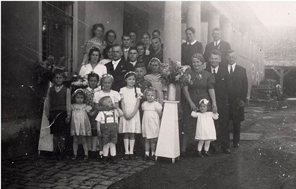
Haupteingang des Schlosses

Erbaut wurde das Gebäude von den Herren von Helmstadt . Im Jahre 1684 kam es in Besitz der Herren von Berlichingen 1 . Noch am Anfang des 19. Jahrhunderts wurde das Anwesen renoviert und von einem Grafen Götz von Berlichingen bewohnt. 2