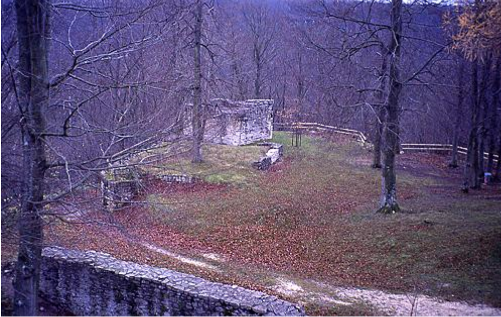
Westliche Burg mit Bergfried und Gebäudefundament, vorne die Abschnittsmauer zur östlichen Burg

Die Zerstörung der Anlage erfolgte 1516 durch Ulrich von Württemberg . Dazu gibt es zwei Versionen der Geschichte: