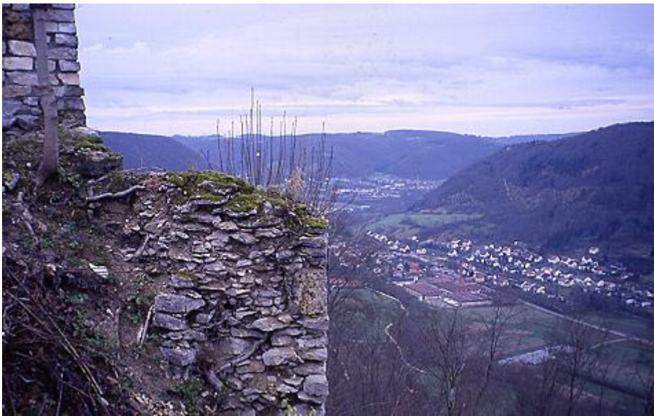
Außenmauer der östlichen Burg mit Blick ins Filstal