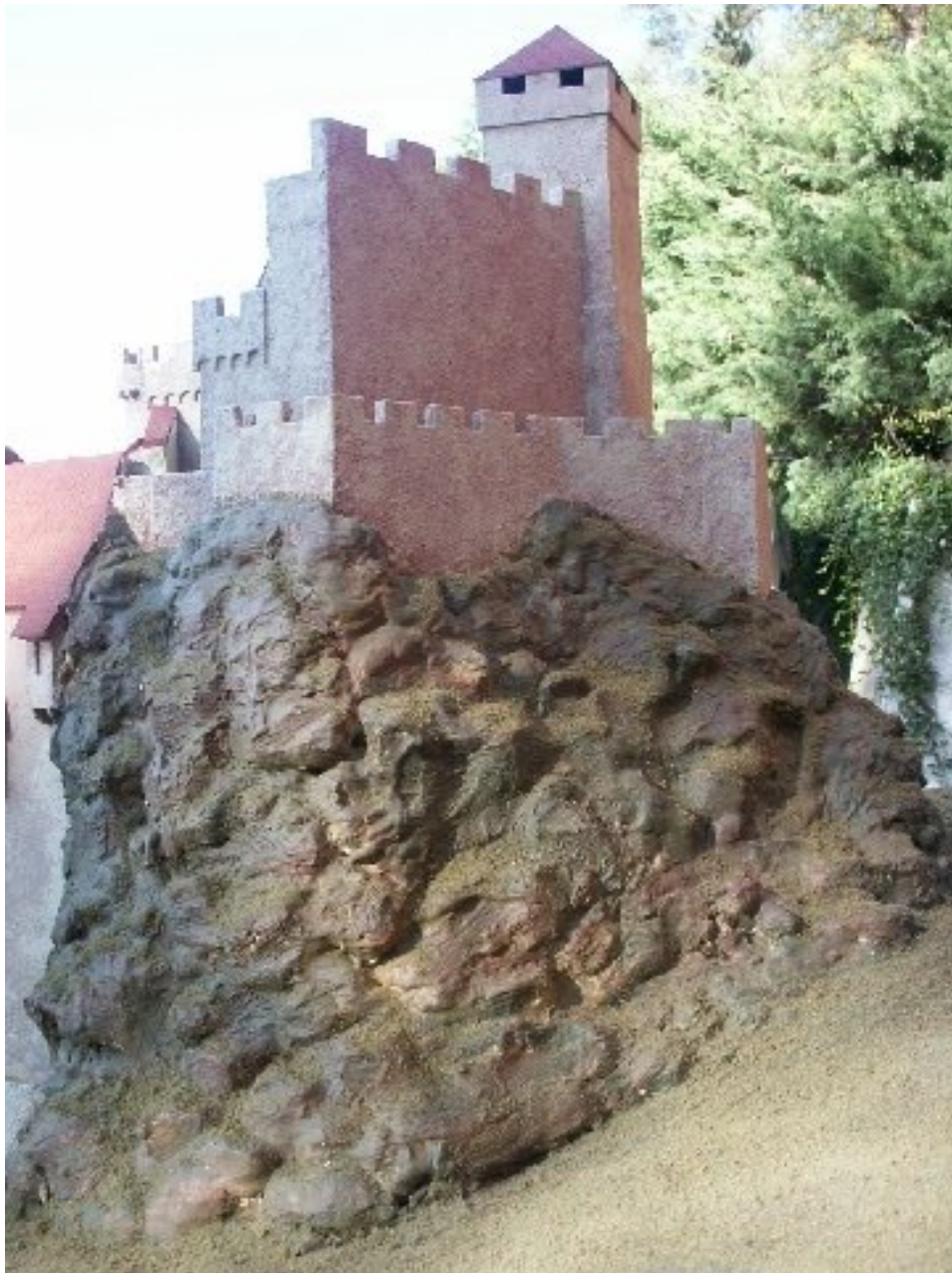
Modell der Kernburg von Osten gesehen