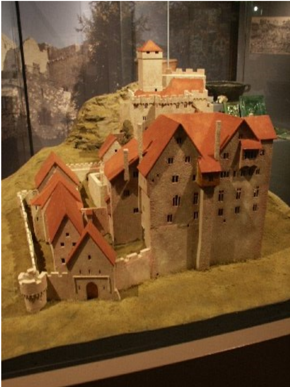
Modell der Burg von Südwesten gesehen