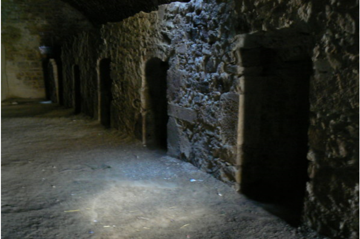
Zellen im Kellergewölbe

Der letzte, spätgotische Ausbau erfolgte unter Jakob I. Dabei wurde der Jakobsbau zwischen dem Bernhardsbau und dem oberen Burgfelsen errichtet. Die dort schon vorhandene Kapelle wurde umgebaut und ein Chorturm auf der Westseite errichtet. Ebenso ein steiler Treppenzugang von der Oberburg zum Jakobsbau, dessen Fragmente am Hohen Mantel der Oberburg noch sichtbar sind und heute ins Nichts führen. Auch ein Zwinger auf der Westseite am Fuße der Burg wurde vor einem dort neu in den Zwinger erbauten Ausfallspörtchen errichtet.