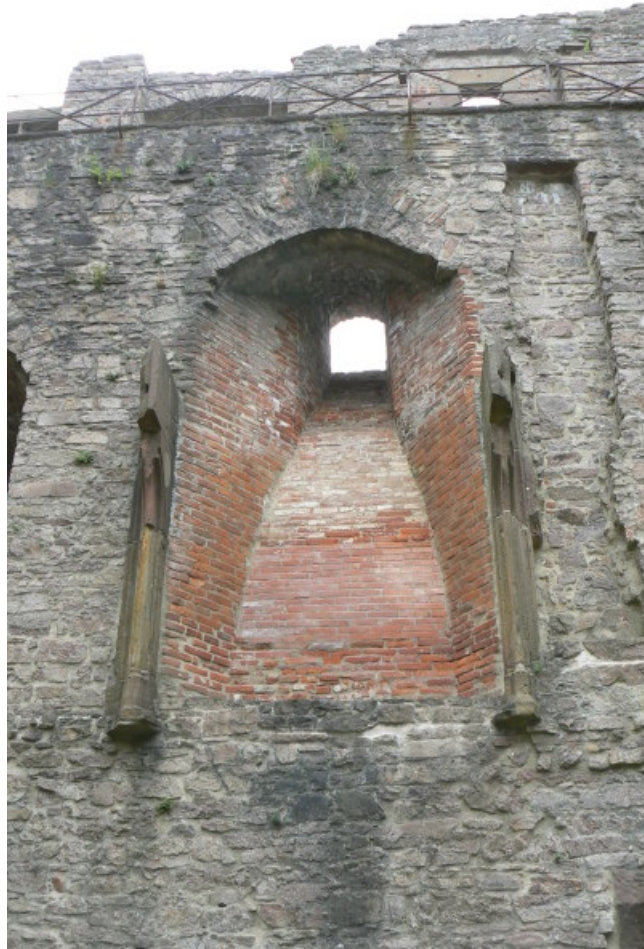
Kamin im Bernhardsbau