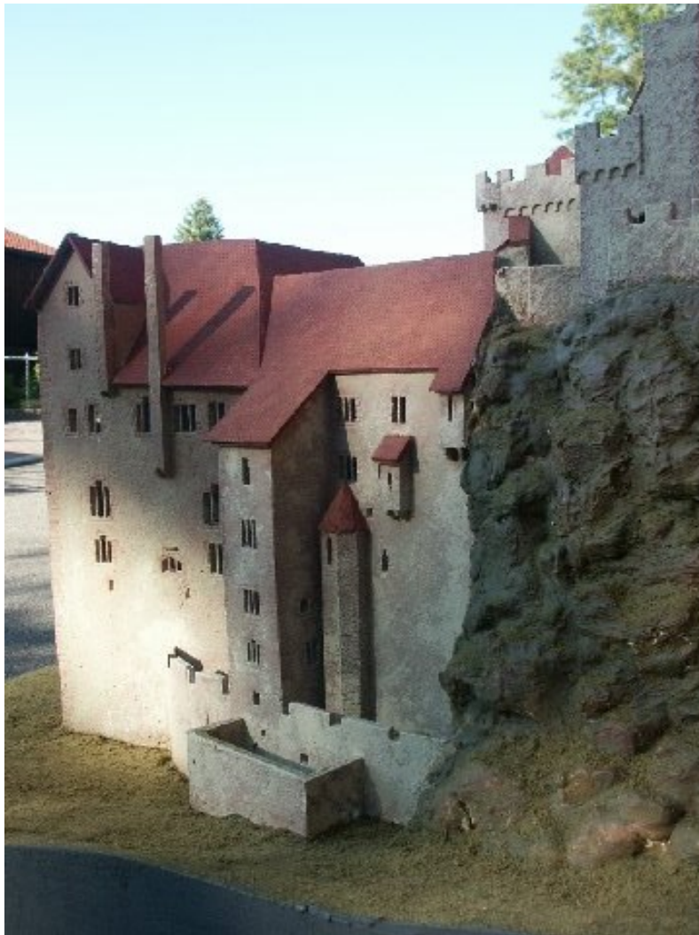
Modell des Bernhardsbaues von Südosten 13

Die Anlage wurde vermutlich durch Blitzschlag Ende des 16. Jahrhunderts zerstört. Heute ist die Ruine am Fuße des Nordschwarzwaldes ein beliebtes Ausflugsziel. Im Landesmuseum Karlsruhe befindet sich ein Modell der Ruine, welches durch Marco Keller und einem weiteren Burgenforscher erbaut wurde.