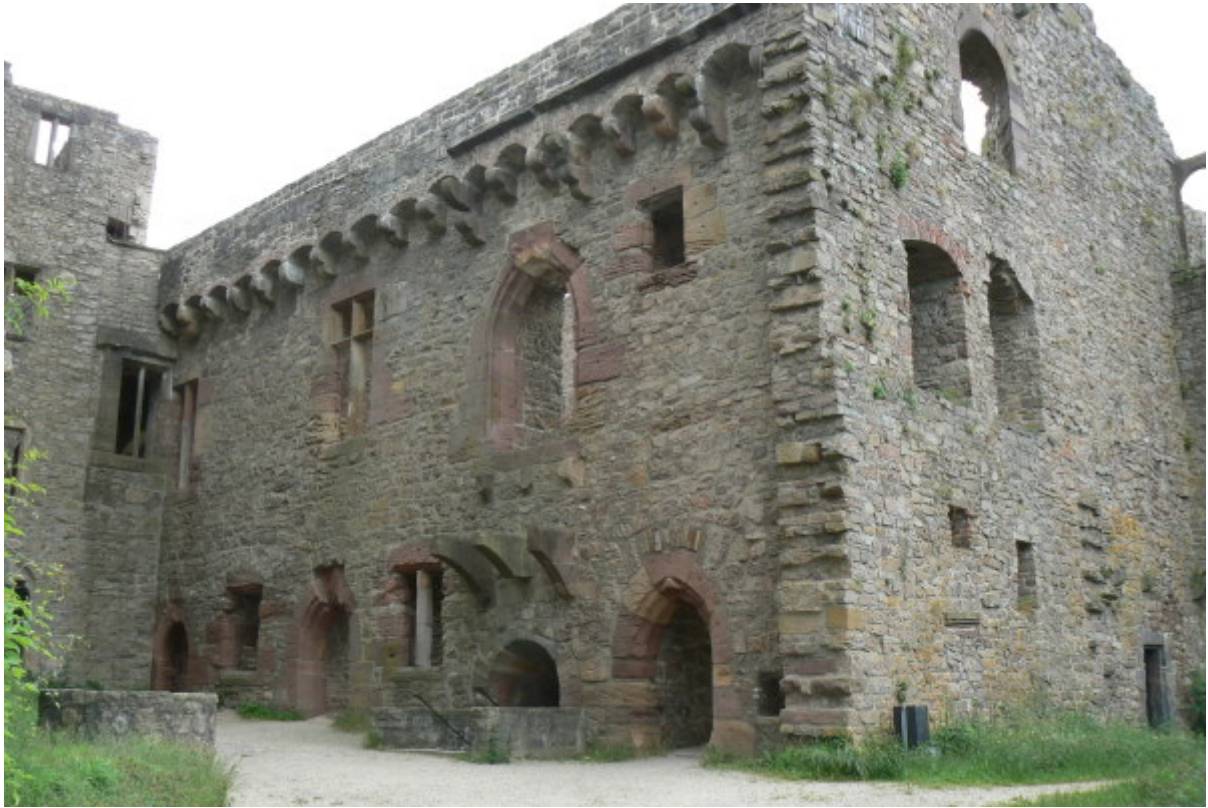
Bernhardsbau von Nordwesten gesehen 9

Im ersten Stock ist ein kleiner Raum auf der Nordseite begehbar, die sogenannte „Loge“. Die Decke mit Birnstabrippen und Hohlkehlen sowie mit den Wappen von Baden und Oettingen geschmückt, Nischen und eine Vertiefung (für Weihwasser?) lassen eine sakrale Nutzung erahnen. Auch die Nähe zur Burgkapelle im nördlichen Jakobsbau lässt dies vermuten. Hier verweisen wir auf die ausführliche Forschung von Wagner/Dendler 10 .