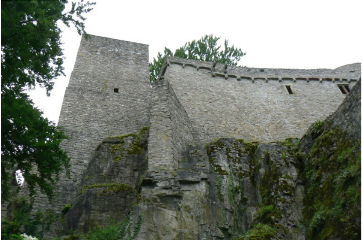
Bergfried und hoher Mantel von Western gesehen