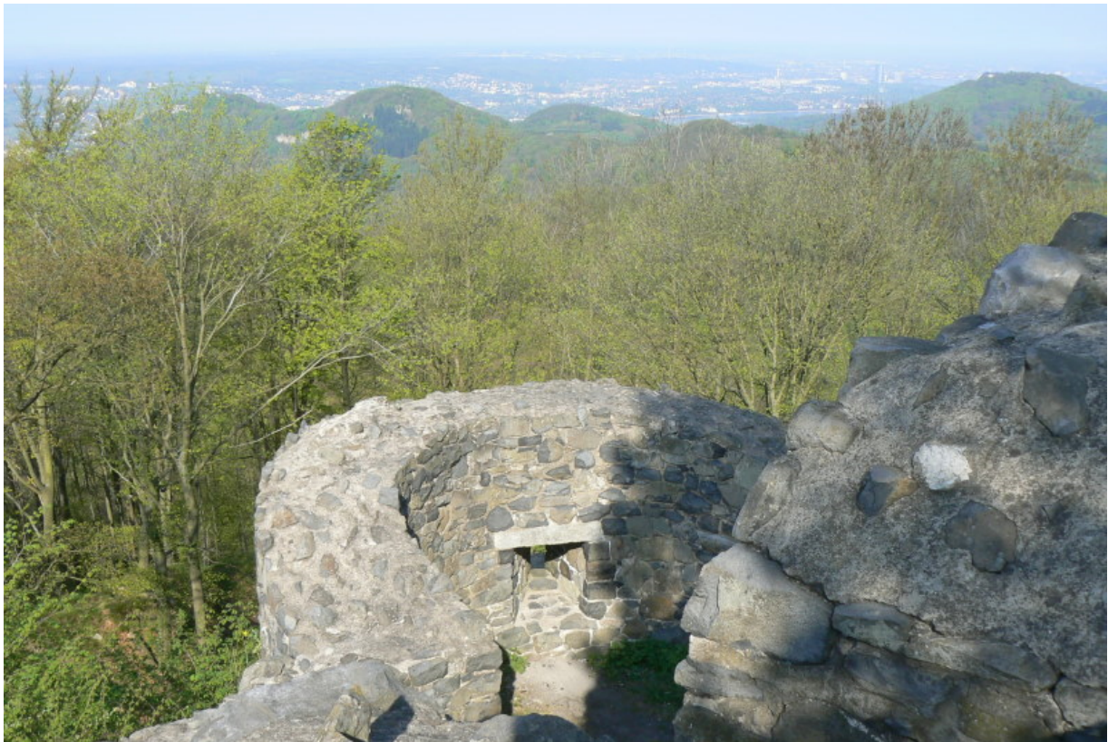
Westseite der Kernburg mit Zwinger und Halbturm

ehemaligen Befestigungen der ehemaligen westlichen Vorburg führt der Weg in den zwingerartigen Zugang auf der Nordseite. Hier betritt der Besucher die ehemalige östliche Vorburg, welche sich auf dem langgezogenen Berggipfel von Osten nach Westen zieht. Die Umfassungsmauer ist noch erhalten. Auf der Ostseite erinnert ein Giebel an das Vorhandensein eines einstigen Gebäudes. Ein rechteckiger Turmrest auf der Südseite ist ansonsten der einzige Hinweis auf ehemalige Bebauung. Heute führt eine Treppe hoch in die westlich gelegene Kernburg, welche von dem einst mächtigen Bergfried geschützt wurde. Der Turm hat eine Kantenlänge von 11 Metern und eine Mauerstärke von 2,2 Metern. Direkt südlich des Turmes befindet sich der schmale Zugang über den einstigen Zwinger in die Kernburg. Die Kernburg wurde von einer Zwingermauer umgeben. Als Befestigung sind zwei rondellartige Halbschalentürme auf der Süd- und Westseite noch erhalten. Westlich des Bergfriedes befand sich der Palas, dessen Fundamente noch erhalten sind. Eine kreisförmige Zisterne ist direkt hinter dem Bergfried an der Palaswand zu finden. Mitten in den Mauerzähnen der Kernburg erhebt sich heute ein Baum. Von diesem Standort aus hat man einen herrlichen Blick in alle Himmelsrichtungen. Auf der Westseite schlängelt sich der Rhein am Drachenfels vorbei.