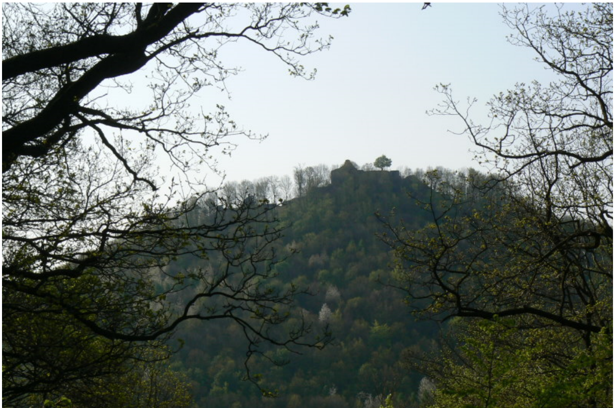
Löwenburg von Nordosten gesehen

Südlich von Bonn erhebt sich das bewaldete Siebengebirge über dem westlich gelegenen Rheintal. Einige der Basalt-, Dolorit- und Trachtylkegel trugen einst stolze Burgen. Das Erholungsgebiet mit weitem Ausblick über das Rheintal bietet viele Wandermöglichkeiten zu den Ruinen der einstigen Burgen. Von der Löwenburg erkennt man die Ruine Drachenfels 1 über dem Rhein. Die Ruinen der Wolkenburg und der Hirschburg auf den Nachbarbergen des Drachenfels bleiben im Wald verborgen.