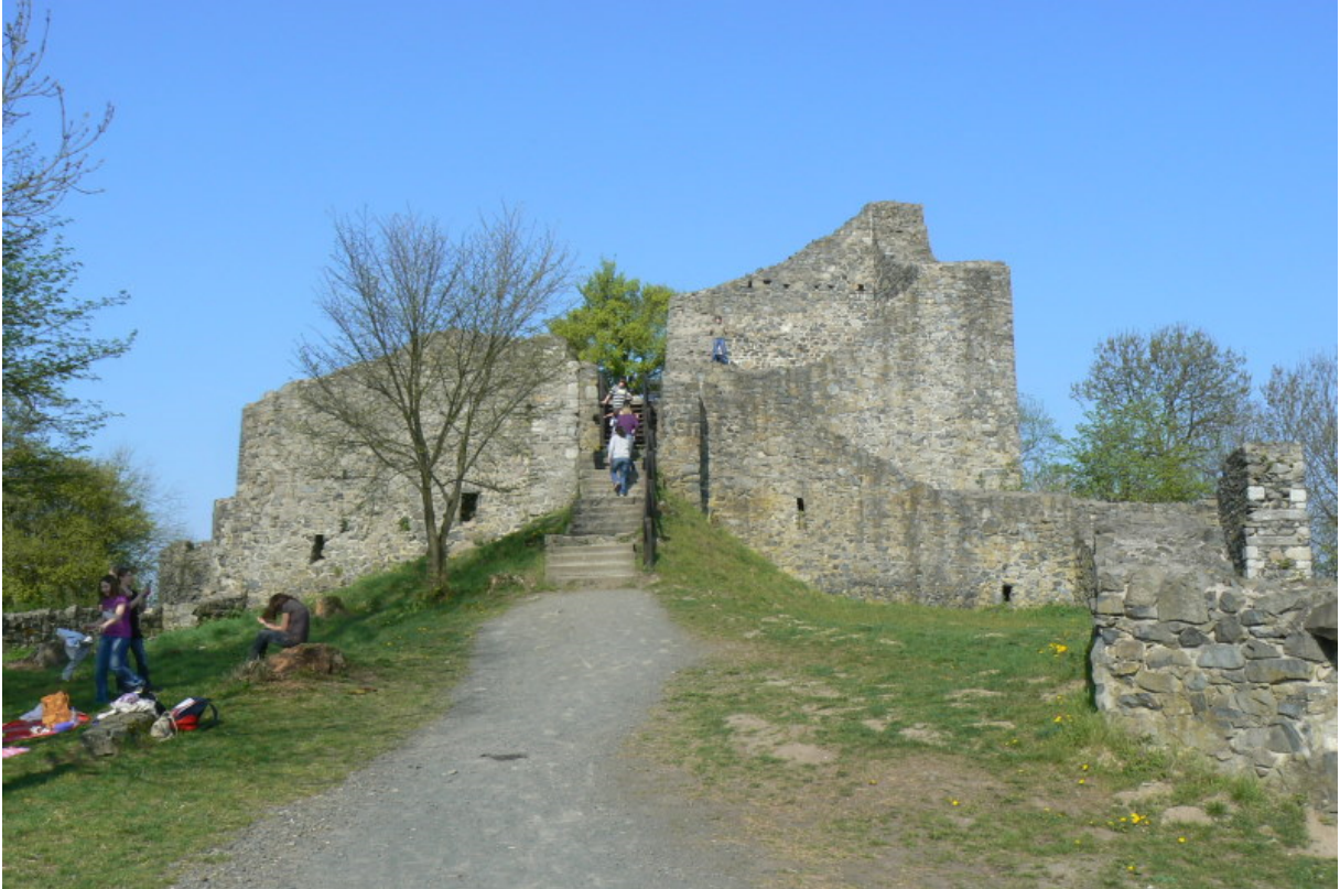
Kernburg von Osten gesehen