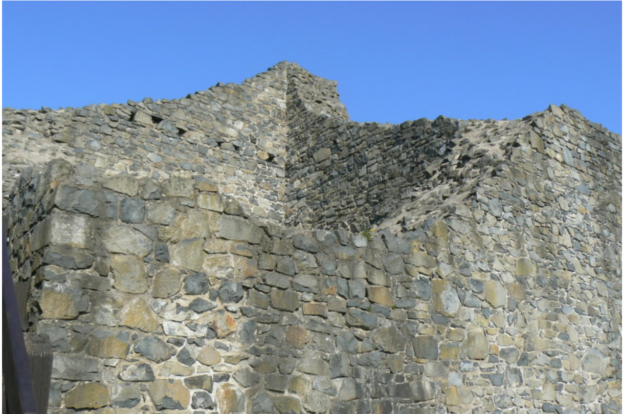
Ostseite des Bergfrieds