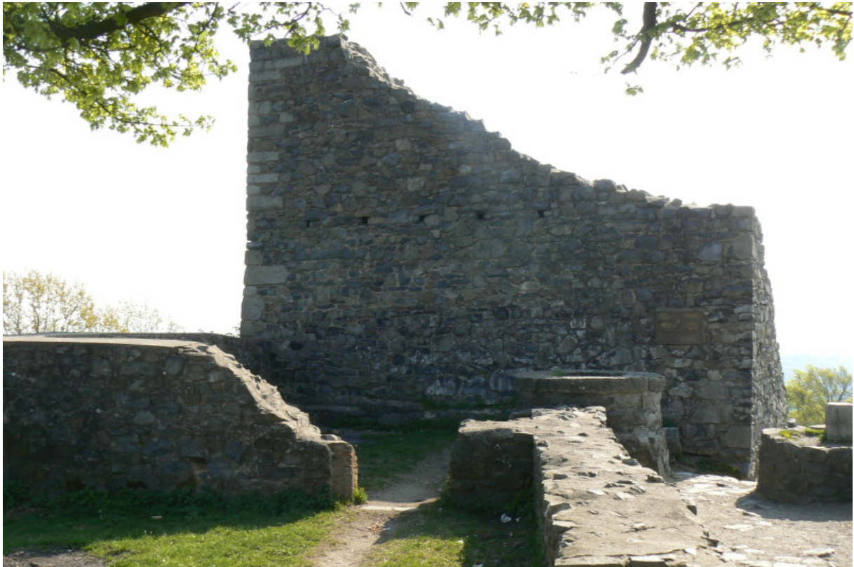
Westseite des Bergfrieds