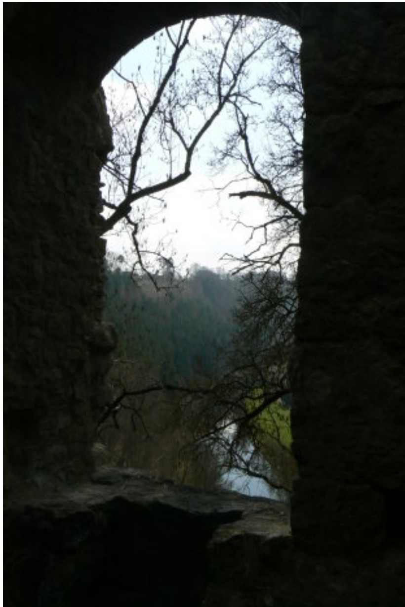
Blick auf den Neckar

Empfehlenswert ist der Besuch der weiter nördlich im Neckartal gelegenen Ruine Hohenstein 9 , deren Reste auf einem Umlaufberg sich unterhalb des Schlosses Hohenstein erheben.