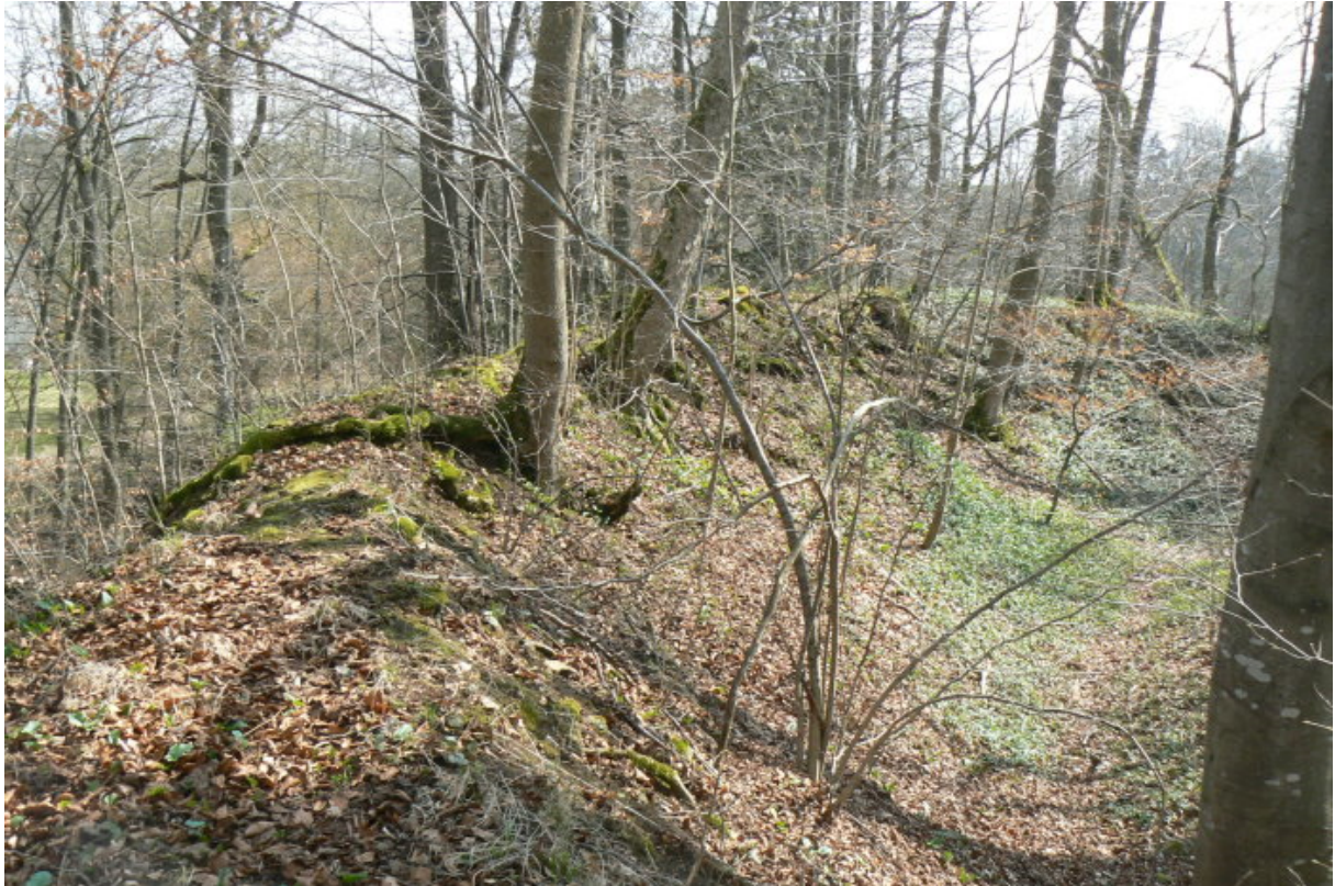
Sichelförmiger Graben und Wall im Norden