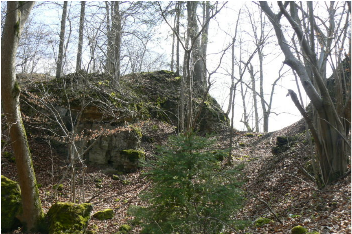
Abschnittsgraben zwischen mittlerem Fels (rechts) und „Hinterer Burg“

Nördlich wird das Plateau der „Vorderen Burg“, wie bereits erwähnt, von einem Fels begrenzt, welcher mehrere Meter breit und lang das Plateau wie eine natürliche, ca. 2 Meter hohe Mauer von einem weiteren Abschnittsgraben im Norden abtrennt. Dieser Felsklotz war sicher einst bebaut. Mörtelreste weisen darauf hin. Eventuell stand hier ein Turm oder eine schildmauerartige Mauer.