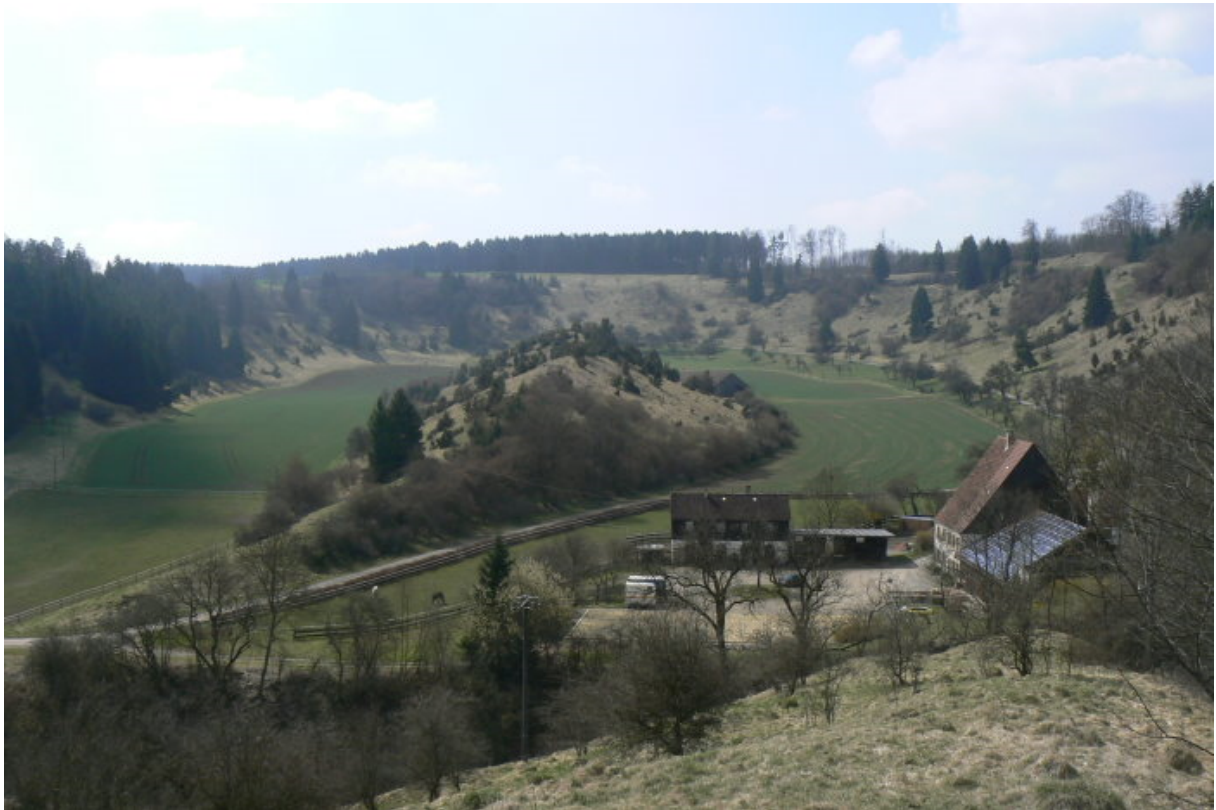
Einstiger Flusslauf mit „Bergle“ und dem Hof Neckarburg von der Ruine aus gesehen

Nördlich davon erhebt sich die Ruine der „Vorderen Burg“, welche man vom Weg über die Westseite erreicht. Zwischen Weg und Ruine befindet sich ein zwingerartiges längliches Plateau. Über dieses führt der Zugang zu einer ebenen Fläche, welche zum Neckar hin auf der Ostseite steil abfällt, nach Norden hin an einem Fels endet und im Süden von der Ruine begrenzt wird. Der ehemalige Gebäudekomplex wirkt kastellartig: Ein rechteckiges Mauergeviert mit turmartigen Anbauten auf der Süd-, Südost und Nordostseite, sowie dem Fundament eines weiteren einst turmartig wirkenden Gebäudeteiles auf der Nordseite. Die Außenmauern dieses Gebäukomplexes sind teilweise noch vier Stockwerke hoch erhalten und die sehr großen, leeren Fensterfluchten unterbrechen die mächtigen Mauern.