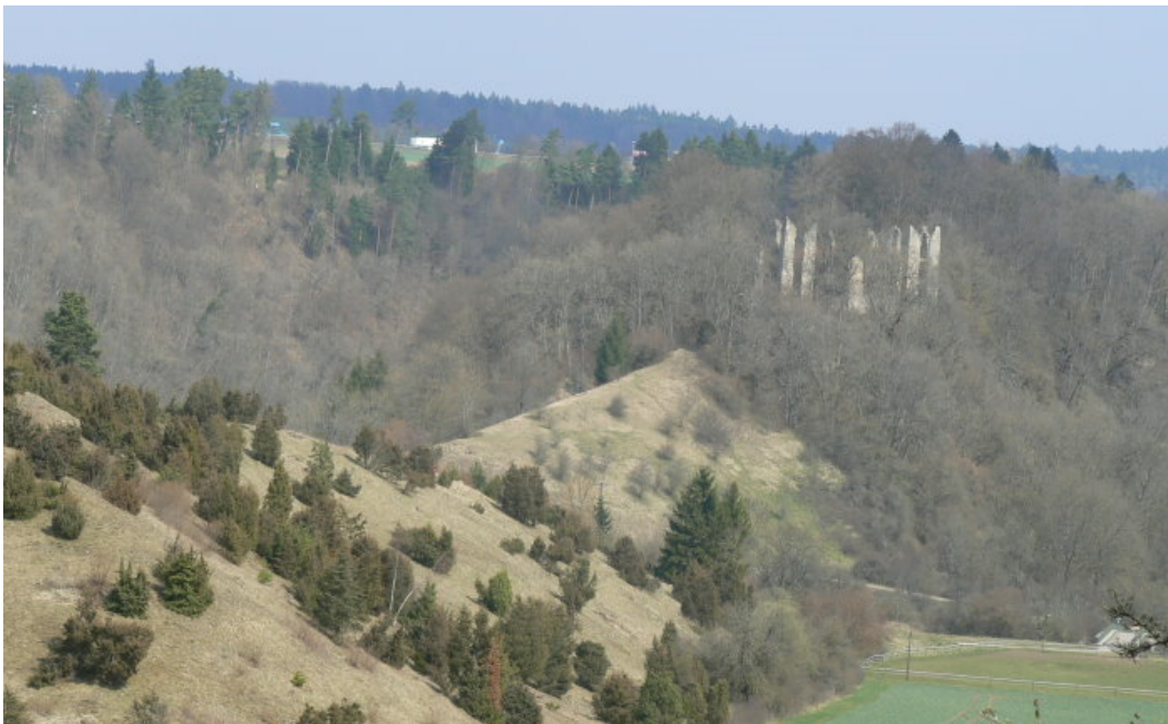
Umlaufberg mit Ruine

Am östlichen Rand des Schwarzwaldes schlängelt sich der obere Neckar durch die Landschaft und hat im Laufe der Jahrtausende ein idyllisches, tiefes Tal geformt. Mehrmals wechselte er den Verlauf und seine Mäander formten einige schöne kuppenförmige Umlaufberge. Auf einem dieser Umlaufberge ragen die steinernen Mauerzähne der Neckarburg wie die Zacken einer Krone aus den Bäumen empor. Reisende kennt den Namen „Neckarburg“ eher von den beiden Autobahnraststätten an der A 81. Direkt östlich davon, neben der mächtigen Autobahnbrücke über dem Neckar, kann man – von Süden kommend- von der Autobahnbrücke einen kurzen Blick auf die tiefer gelegenen Ruine erhaschen.