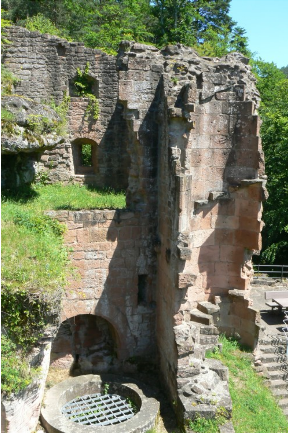
Treppenturm, Palas und Zisterne