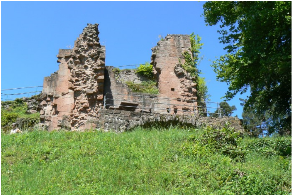
Palas von Osten gesehen

Der Besucher nähert sich von Norden auf der Ostseite des zum Ort hin verlaufenden Bergspornes. Vorbei an dem tief in den Bergsporn geschroteten Halsgraben passiert man die ehemalige Toranlage, bei der etwas unterhalb vom heute verlaufenden Weg eine schmale Schlupfpforte freigelegt wurde. Der Weg führt vorbei an dem zum Halsgraben glatt gehauenen Felsklotz der Burg und dem östlich daran angebauten Palas, welcher zum Halsgraben schildmauerartig verstärkt ist. Der Rest eines weiteren, mit einem Gewölbe unterkellerten Gebäudes schließt sich daran an. Ein Mauerrest mit einer schießschartenartigen Öffnung befindet sich direkt über dem ehemaligen Tor. Der Weg folgt weiter einem ehemaligen Torzwinger in Richtung Spornspitze. Die Mauern der Zwinger sind nicht mehr erhalten.