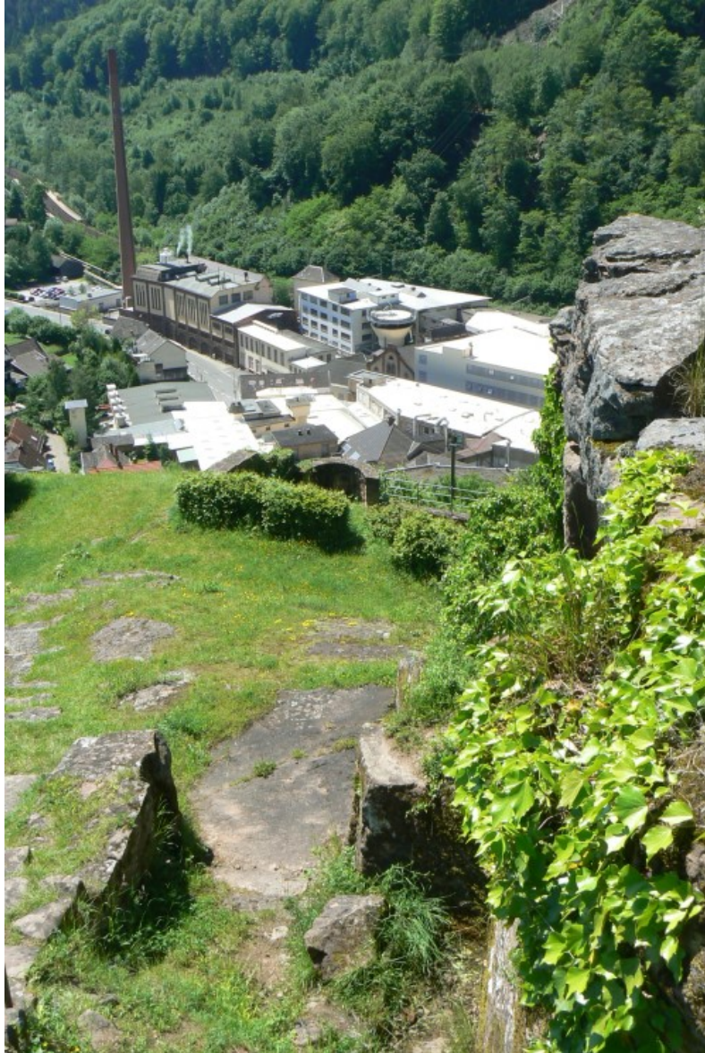
Blick vom Burgfelsen nach Süden

Die Ruine ist frei zugänglich. Lohnenswert ist der Besuch der mächtigen Burg Burg Neuscharfeneck 9 weiter südöstlich in der Pfalz, bzw. die Burg Wolfsburg 10 über Neustadt.