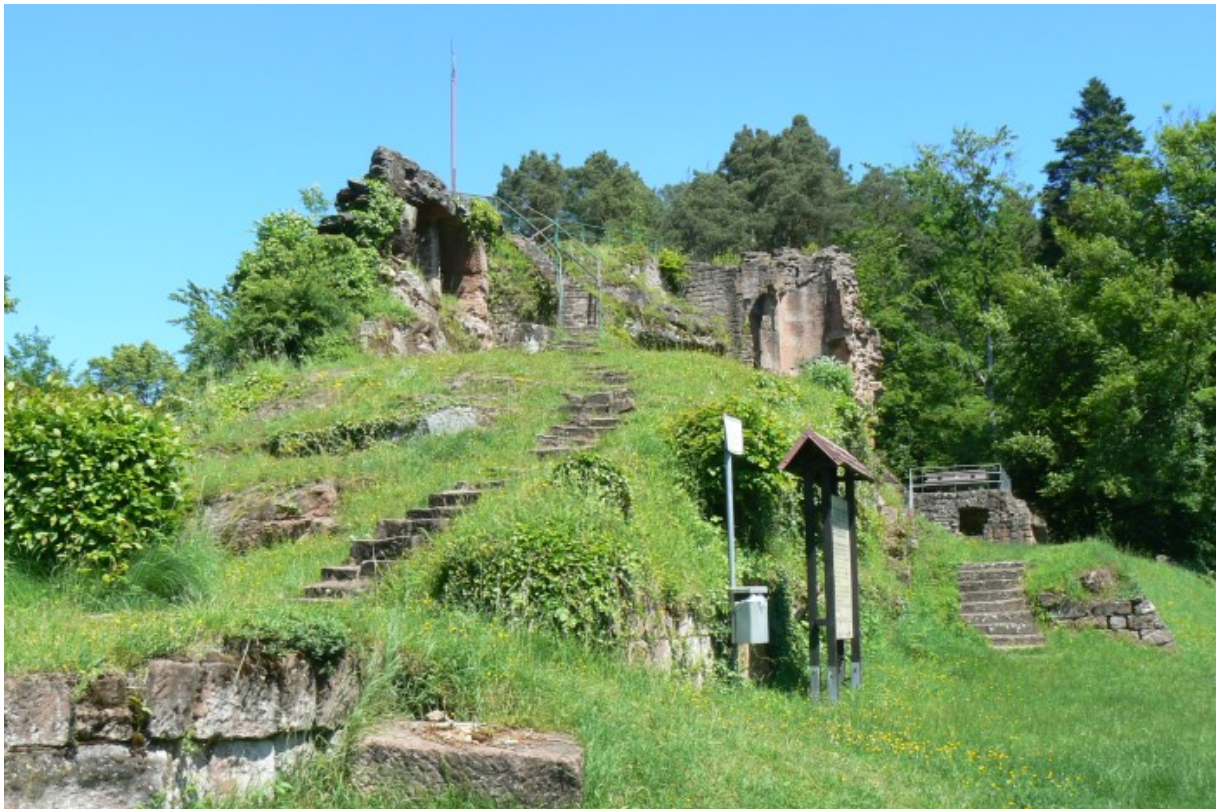
Burg von Süden gesehen

einer Mauerlaibung gestützt. Über dem Gang verläuft eine Treppe zu einer weiteren Ebene nach oben auf den Burgfelsen. Von hier führt die Treppe hoch auf das oberste Plateau des Felsens. Mauerreste sind hier nicht mehr vorhanden. Westlich dieses Burgfelsens verlief der Zwinger bis zum Halsgraben nach Norden. Hier stehen die Reste eines runden Flankierungsturmes und weitere Mauerreste eines Zwingers. Eine mächtige (neuerzeitliche?) Stützmauer stützt den Felsüberhang zum Zwinger. Hier auf der Westseite soll ein weiteres Gebäude am Fels gestanden haben. Im Süden des Spornes befinden sich die Reste zweier halbrunder Türme zum Tal hin. Diese wurden an der Südostspitze der Burg von zwei bastionsartigen, hintereinander gestaffelten Mauerzügen flankiert. Eine Mauer soll einst den Bereich zwischen dem Burgfelsen und den Halbschalentürmen in eine Ost- und Westhälfte getrennt haben. Der Aufbau der Ruine erinnert an andere Felsenburgen wie die Burg Fleckenstein 2 , Burg Drachenfels 3 oder Burg Wasignstein 4 .