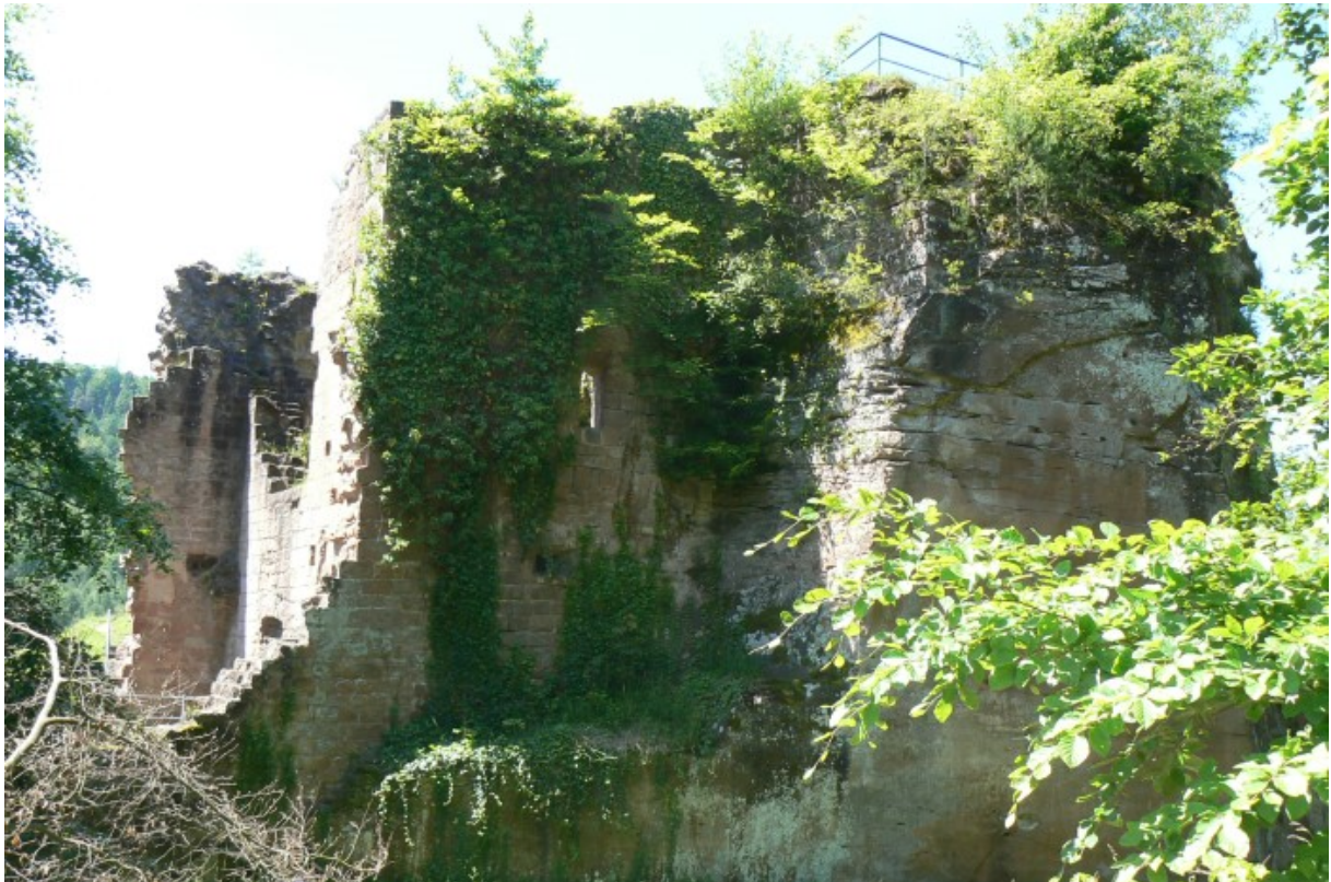
Blick vom Halsgraben auf den Palas (links) und den Burgfelsen (rechts)

Hoch auf einem Bergsporn über dem gleichnamigen Ort im Kreis Bad Dürkheim befindet sich die romantische Felsenburgruine, deren Sitzbänke zu einer Rast einladen. Die bewaldeten Talhänge und der beschauliche Ort wirken beruhigend. Nur die Fabrik im Ort mit ihrem mächtigen Schornstein stört die Idylle. In der Nähe der Burg befindet sich die Ruine der Burg Lichtenstein.