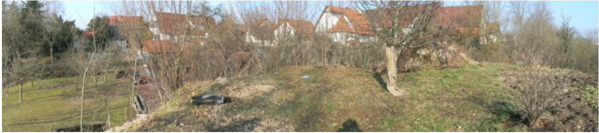
Burghügel nach Norden gesehen