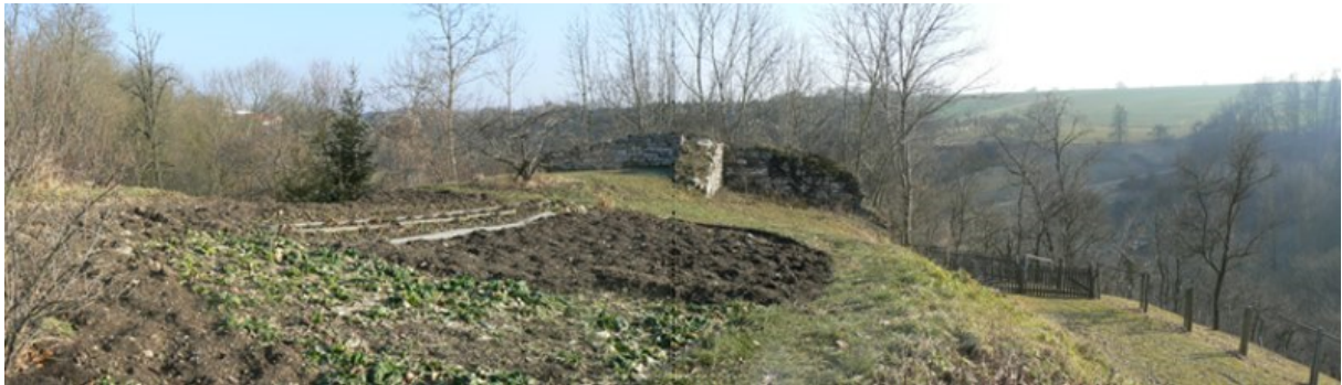
Burghügel nach Süden gesehen