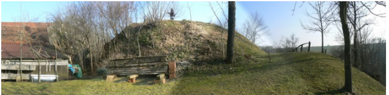
Burghügel Halsgraben (links) Zwingerterrasse (rechts) von Nordwesten

eine Erhöhung des Burghügels an, um eine steile Wand zum Graben hin zu erschaffen. An der Nordostspitze des Burghügels liegt das große Turmfragment des einstigen eckigen Bergfriedes unzerbrochen auf der Erde. Der Turm hatte einen Innendurchmesser von 1,9 auf 1,6 Meter. Die Außenwände sind ca. 2 Meter dick gewesen. Heute wirkt das Fragment rund, da die Kanten abgebrochen sind. Auf der Südseite des Turmteiles ist aber eine plane Außenseite aus grob gehauenen Quadern gut zu erkennen. Die Höhe des Fragmentes beträgt ca. 3,6 Meter. Der Turm soll einst auf dem Burghügel gestanden haben- ein Mauerrest ist über dem Fragment auf dem Hügel sichtbar. Aber wo befinden sich die Fundamente, die bis tief in den Hügel vorhanden sein müssten? Stand vielleicht der Turm doch leicht versetzt im Graben? Wie kam das Fragment in die jetzige Position? Einwohner erzählen, dass nach dem Krieg Steine der Burg abgebaut wurden und das Fragment offenbar vom Burghügel in den Graben gestürzt ist. Vielleicht handelt es sich ja um den unteren Teil des Turmes- das Fundament sozusagen?