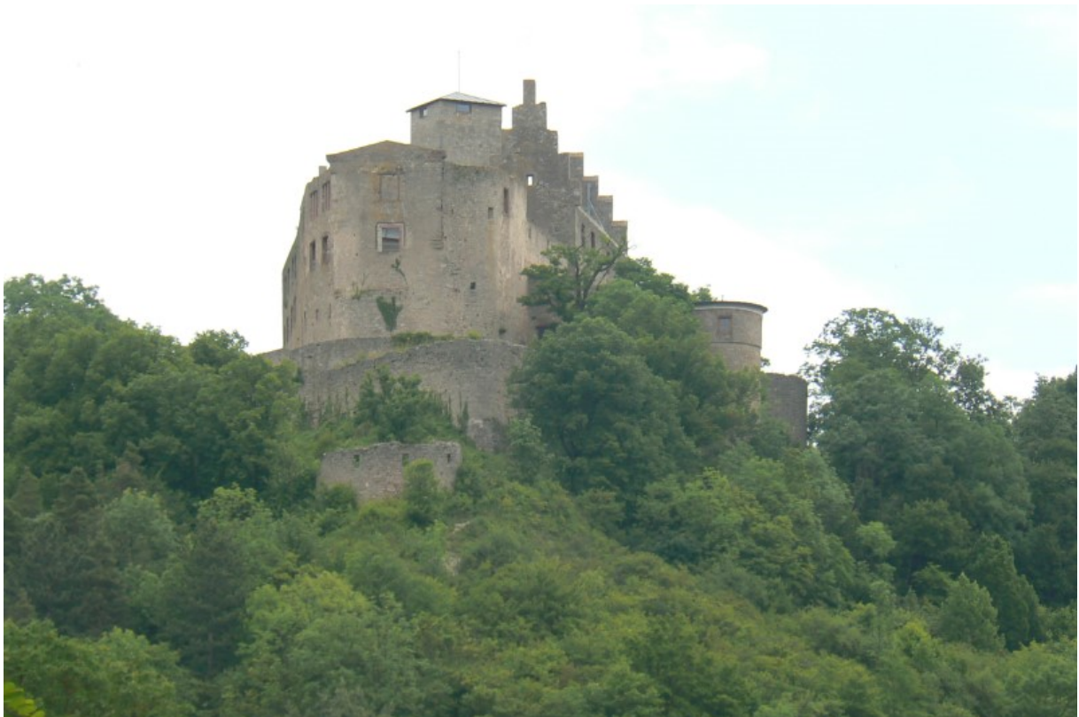
Blick vom Tal hoch zur Burg

Auf einem nach Westen verlaufenden Bergsporn ragen die gut erhaltenen und sanierten Ruinenreste der Trimburg am südlichen Rand der Bayrischen Rhön über die Talebene. Die Spitze der Burg zeigt nach Westen in Richtung der Burg Saaleck. Festungsartig ausgebaut macht die Burg einen wehrhaften Eindruck.