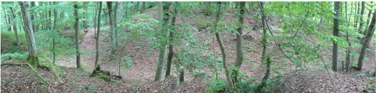
Ostgraben des Burgstalles vom Burggelände gesehen

Die alte Trimburg befand sich weiter östlich der heutigen „neuen“ Trimburg auf dem Bergkamm. Einige hundert Meter von der großen Ruine Trimburg entfernt findet man an dem nach Osten ansteigenden Berggrat den Burgstall der ersten Trimburg. Nur noch Wälle, Gräben und Vertiefungen erinnern an die verschwundene Burg. Die kastellartige Burg bestand aus einem Rechteck, welches auf vier Seiten von Gräben und einem Wall umgeben war. Vertiefungen im waldigen Burggelände erinnern an Positionen ehemaliger Gebäude. Die Erbauer der neuen Trimburg recycelten das Baumaterial komplett. Nicht einmal Ziegelscherben blieben übrig. In den Fundamenten der neuen Trimburg findet man diese Mönch- und Nonnenziegelfragmente als Füllmaterial verbaut.