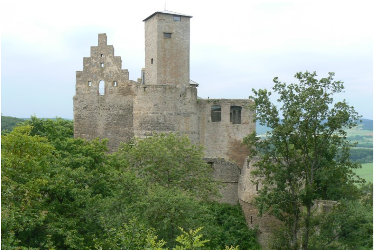
Burg von Osten gesehen

Vor der Westspitze der Burg sind Reste eines Vorwerkes am Hang erkennbar. Zum Halsgraben hin befindet sich ein weiterer Zwinger auf der Ostseite. Nach diesem Zwinger führt der Weg zur Kernburg durch einen breiten Torbogen über einen rampenartigen Zwinger hoch zum Eingang in die auf dem Felsen errichtete Kernburg. Am südlichen Sperrwerk erreicht man den schmalen Hof der Kernburg. Auf der Nordseite befinden sich die Reste des älteren Palas, dem Echterbau mit Treppenturm im Stil der Spätrenaissance auf den Resten des romanischen Palas. Der südliche Palas, der Erthalbau, dessen Giebel sich noch hoch über der Ruine erheben, befindet sich südlich vom Hof. An der Ostseite der Kernburg dominiert der über Eck stehende Bergfried mit 5 Metern Seitenlänge und 19,5 Metern Höhe, dessen Eingang sich ca. 8,5 Meter über dem Hof befindet. Vor dem Bergfried ist die 2,1 bis 2,9 Meter dicke Westmauer halbrund ausgeführt.