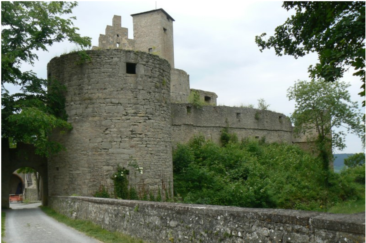
Batterieturm und Halsgraben von Osten gesehen

Die gesamte Burganlage thront wie ein steinernes Schiff auf dem Sporn- ähnlich wie die Wegelnburg 2 in der Pfalz. Man betritt die Burg von Osten, südlich vorbei an einem felsigen Plateau, welches eventuell einst von einem Vorwerk überbaut war. Über einen breiten, in den Fels gehauenen Halsgraben, der an seiner Südseite von einer Sperrmauer verschlossen ist, führt eine steinerne Brücke in den südlichen Burgzwinger. Der Halsgraben wird von einer hohen Mauer geschützt. Er wird im Süden am Tor von einem mächtigen, dicken Batterieturm flankiert, der nach innen zur Burg geöffnet ist. An der Nordecke der Mauer befindet sich ein weiterer, kleinerer Rundturm. Die komplette Burganlage ist entlang der Bergspornkontur von einer Zwingermauer umgeben, welche von drei Halbschalentürmen und einem v-förmigen Bollwerk flankiert wird. Der Zwinger verläuft zur Bergspornspitze wie ein Schiffsbug schmal und halbrund zusammen. Der Zugang vom südlichen Torzwinger zum westlichen Zwinger wird durch ein Sperrwerk, das quer an die Kernburg angebaut ist und über den Zwinger herausragt, verhindert.