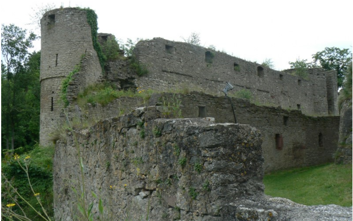
Ostmauer zum Halsgraben aus dem Zwinger gesehen

Einige Sagen ranken sich um die Trimburg: