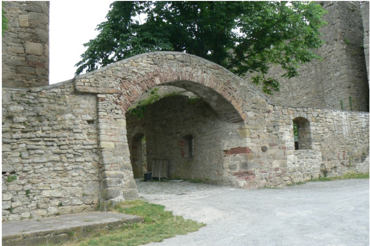
Torbogen vom südlichen Torzwinger in den Ostzwinger

die Schweden wieder ab, da sie sich sicher waren, dass die Trimberger nicht auszuhungern waren wenn sie sogar mit Nahrungsmitteln schossen.