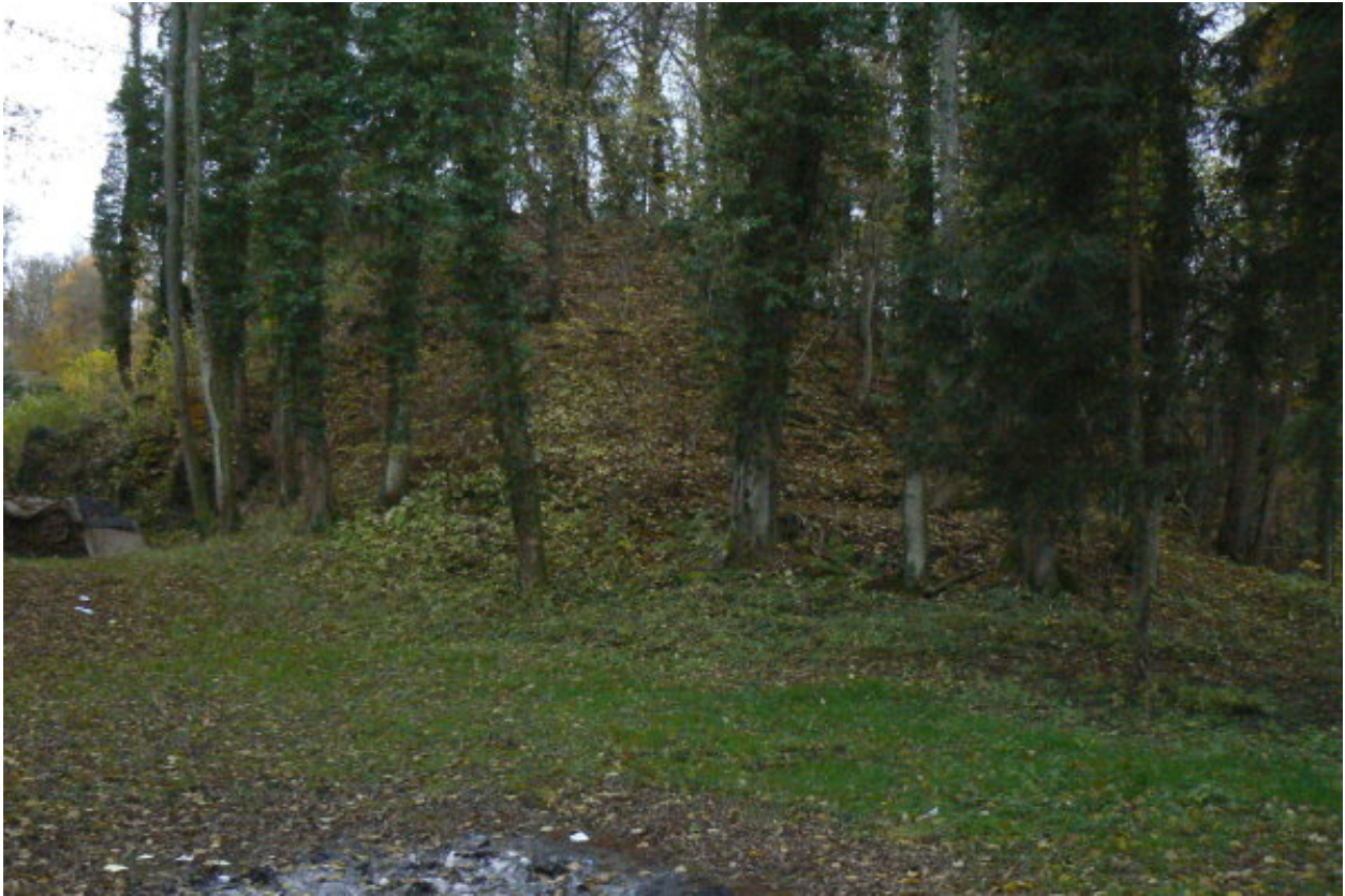
Burghügel von Osten gesehen- im Vordergrund das Plateau der Vorburg

Spornspitze hin verläuft. Eventuell befand sich auf der Spornspitze ebenso eine Bebauung, die strategisch interessant gewesen wäre, aber nicht nachweisbar ist. Vom Burgplateau muss sich auf der Nord- oder Ostseite ein Ausgang zum Burghügel befunden haben. Auf dem nahezu rechteckigen Burgplateau, welches ca. 11 Meter auf 19 Meter misst, sind keine baulichen Reste zu erkennen. Auf der Nordostseite lässt sich das Fundament eines Gebäudes erahnen. Ebenso auf der Südseite Reste von Fundamenten der Ringmauer als leichte, wallartige Erhöhung. Neben dem Gebäude der Gastwirtschaft befinden sich am Zugangsweg auf der Ostseite Mauerzüge und Reste eines Halbrundturmes zu erkennen. 4 Auf der Nordseite ist ebenso ein Mauerrest am Hang sichtbar.