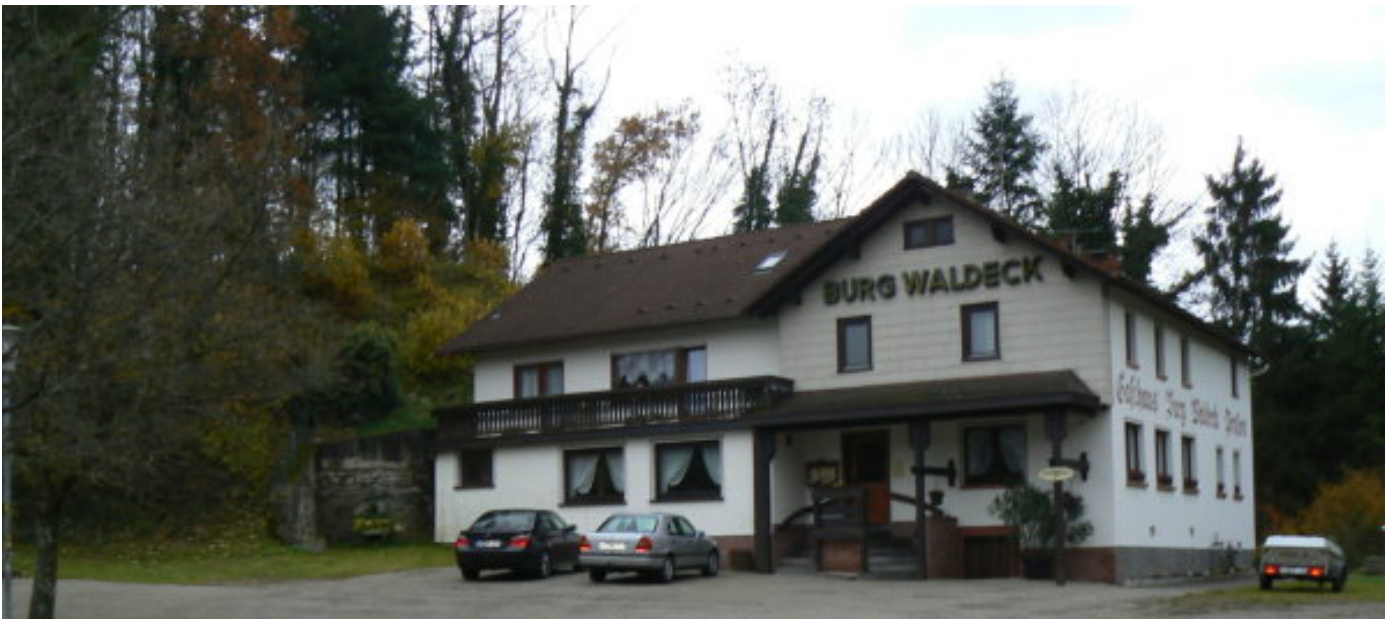
Blick von Osten auf das Gasthaus, links der Burghügel

Der Burgname Waldeck taucht in Europa öfter auf. Nicht nur die sich bei Calw befindende Ruine Waldeck 1 , auch mehrere Burgen in Frankreich, Hessen, Böhmen und Bayern tragen diesen Namen 2 und machen eine Quellenzuordnung schwierig. Auf einem nach Osten ins Steinachtal verlaufenden Bergsporn wurde eine kuppenartige Erhöhung als idealer Standort einer kleinen Burg gewählt. Reste der Anlage lassen sich heute nur noch erahnen.