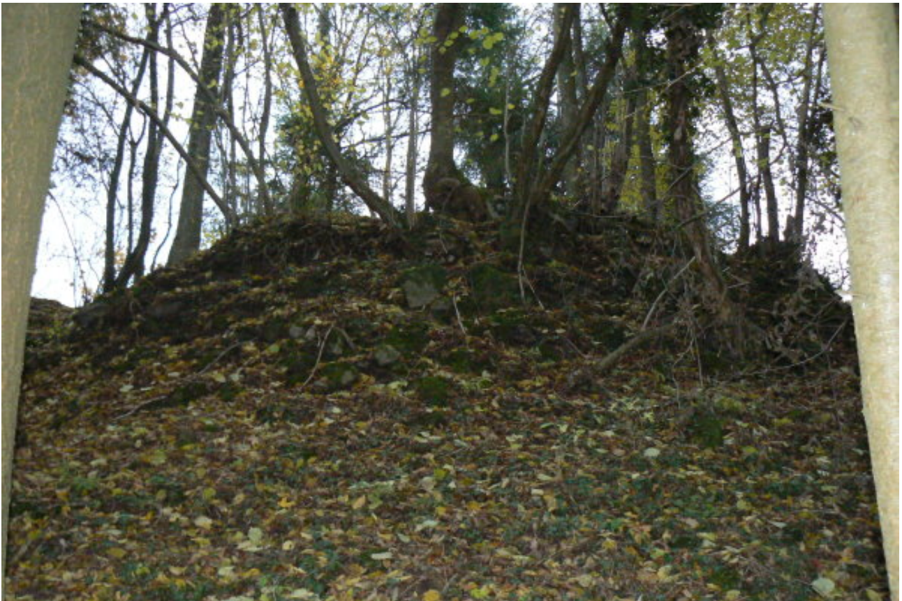
Burghügel von Norden gesehen

Zerstört wurde die Burg um 1622 im Dreißigjährigen Krieg von kaiserlichen Truppen unter Tilly. Die Burg wurde nicht mehr aufgebaut. Die Ruine und die Wirtschaftsgebäude gingen 1747 in Besitz des Heiligkreuzsteinacher Schultheißen Hironimus Gerhäuser über. Die Reste der Burg wurden als Steinbruch verwendet und völlig abgetragen. Auf einem Hügel bei Lampenhain sind Reste einer kleinen Burg zu erahnen, auch der Gewannname „Burgschell“ lässt eine Vorgängerburg oder Nachbarburg der Burg Waldeck erahnen.