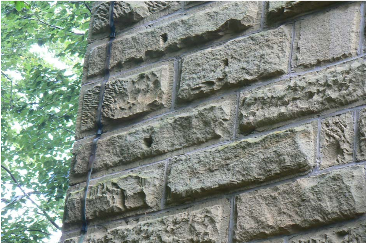
Hochmittelalterliche Buckelquader im Aussichtsturm

Heute befindet sich auf dem ebenen Plateau auf der steil in den Stichgraben abfallenden Ostseite ein hoher, steinerner Aussichtsturm, in dem Reste mittelalterlicher Quadersteine sichtbar sind. (Bosselquader mit und ohne Randschlag, hochmittelalterliche Buckelquader mit Zangenlöchern 1 .) Die Rekonstruktion des einstigen Aufbaues der mittelgroßen Burganlage anhand der Geländeform wird erschwert durch spätere Bautätigkeiten (Michaelskirche und Aussichtsturm). Aus diesem Grunde wurde das Areal auch von uns nicht vermessen oder skizziert, da zu viele falsche Parameter Fehlinterpretationen des einstigen Grundrisses der Burg zulassen würden.