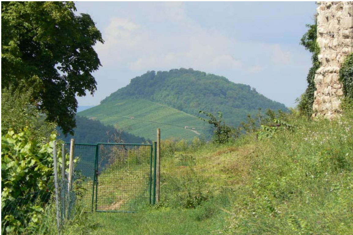
Der Wunnenstein von Burg Lichtenberg gesehen

Südöstlich von Ilsfeld ragt am nördlichen Rand des Landkreises Ludwigsburg die 394 m hohe, bewaldete Bergkuppe Wunnenstein aus dem Bottwartal. Auf diesem Hügel stand einst die gleichnamige Burg. Heute kennt jeder Autobahnpendler der A 81 Heilbronn- Stuttgart die Raststätte Wunnenstein bei Ilsfeld, in deren Nähe der heutige Aussichtsturm über die Baumkronen des Wunnenstein ragt. Zu erreichen ist der Burgplatz über die Ausfahrt Ilsfeld, von dort östlich in Richtung Beilstein und rechts abbiegen und durch den Abstetter Hof hoch auf den Wunnenstein fahren.