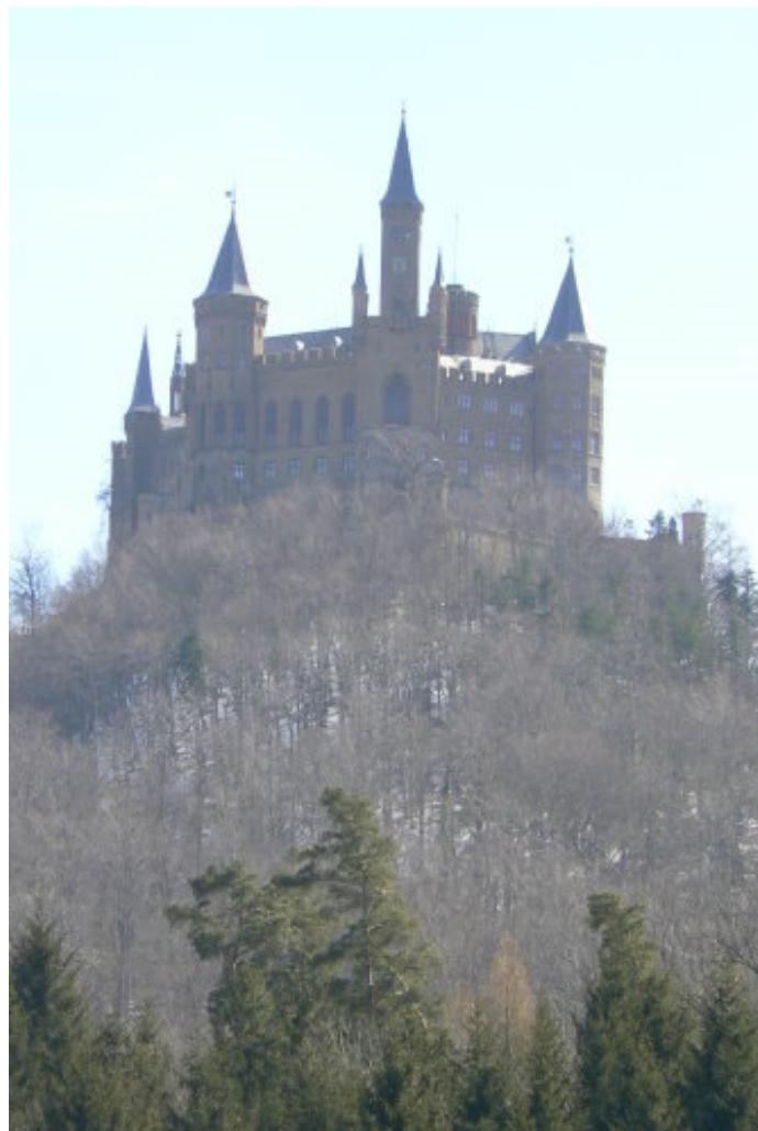
Hohenzollern von Norden gesehen

Von Tübingen erreicht man über die B 27 die Stadt Hechingen, bzw. von der A 81 Ausfahrt Empfingen (Ausfahrt 31) ist der Bergkegel des „Hohen Zoller“ mit der gleichnamigen Burg gut sichtbar. Südlich von Hechingen führt eine Straße zu Parkplätzen unterhalb der Anlage.