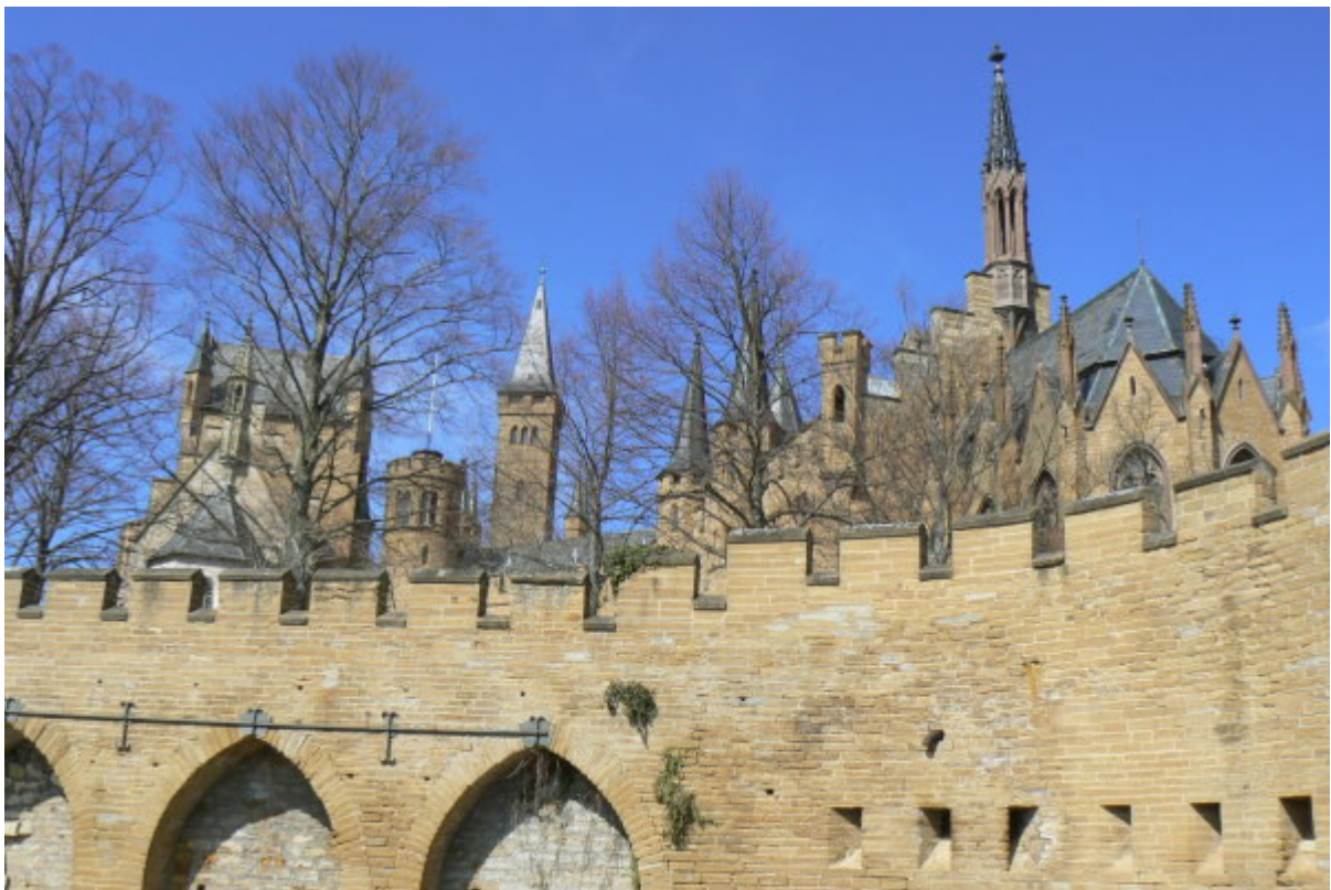
Blick auf die Kernburg von den Auffahrtsrampen

Von 1618-1623 wird der Hohenzollern zur Festung ausgebaut (zweite Anlage) und erhält die heute noch vorhandene zwingerartige Bastionsfestung. Es kommt zu weiteren Besetzungen durch Württemberg (1634) , Bayern (1635-37) und durch die Franzosen (1744-45). Danach fällt die Anlage in militärische Bedeutungslosigkeit. Der preußische Kronprinz Friedrich Wilhelm IV entscheidet sich 1819 für den Wiederaufbau der verfallenen Ruine seiner Vorfahren einzusetzen 14 und beginnt das Projekt als König . 1850 beginnt Prinz Wilhelm I. von Preußen mit dem eigentlichen großen Aufbau der Burg. Er weiht 1867 als König die neue Burg ein. Nach dem Zweiten Weltkrieg werden die sterblichen Überreste von König Friedrich Wilhelm I. und König Friedrich dem Großen bis zur Wiedervereinigung auf der Burg aufbewahrt. 1991 kehrten die beiden großen Könige zur letzten Ruhestätte nach Potsdam und Sanssouci zurück. Aufwändige Sanierungsmaßnahmen erfolgen Ende der 1990er Jahre, 15 u.a. werden Schäden des Erdbebens von 1978 beseitigt.