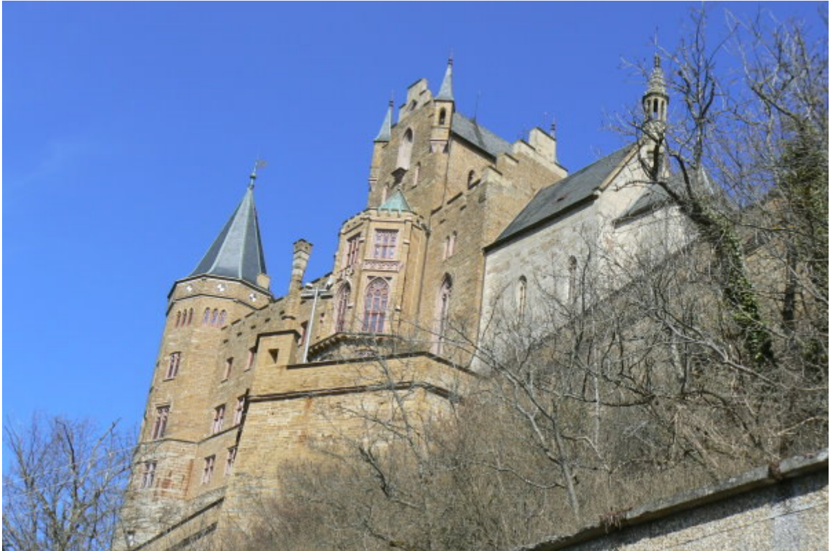
Garten-Bastei mit St. Michaels-Kapelle (rechts)

Kosten spielten bei diesen Bauten keine Rolle, romantische, verspielte Details in Verbindung mit von originalen Burgen und Festungen übernommenen wehrtechnischen Funktionen bieten dem heutigen Besucher eine märchenhafte, aber unwirkliche Kulisse 5 . Blickt man in die Ferne nach Norden über Württemberg im Schatten der mächtigen Mauern mit Ritterfiguren und Denkmälern vergangener Könige gekrönt, könnte man denken, dass hier Tolkien seine Ideen für die phantastische Festungsstadt „Minas Tirith“ für den Roman „Herr der Ringe“ 6 geboren hat.