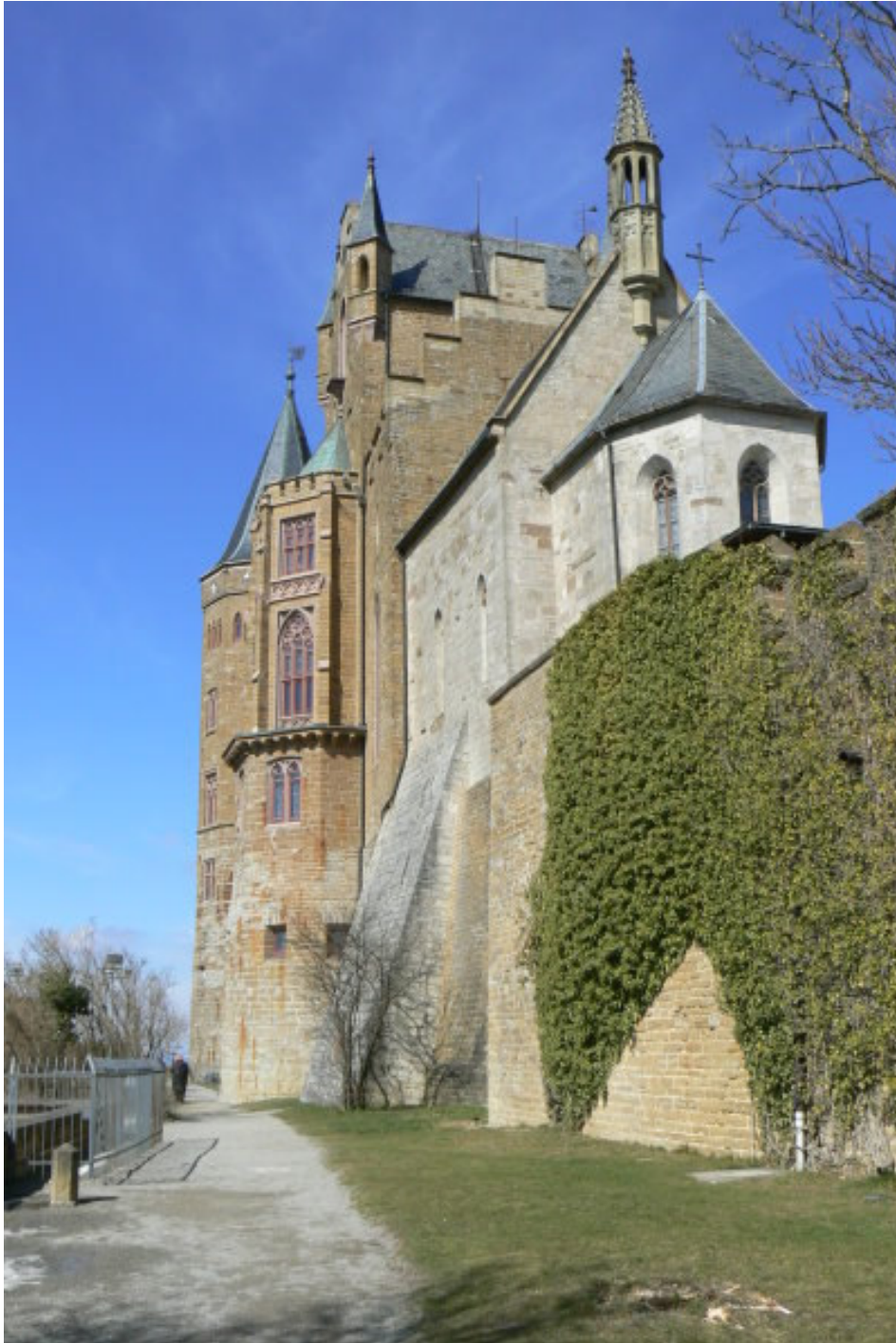
St. Michaels-Kapelle vom Zwinger aus gesehen

Der Besucher erreicht die heute existierende dritte Anlage über eine steil in Serpentina ansteigende Straße (vorbei am sogenannten Wasserturm mit Pumpanlage am Nordwesthang unter der Burg) und erreicht die 850 Meter über dem Meeresspiegel stehende Burg auf dem am Rande der Alb sich erhebenden „Hohen Zoller“.