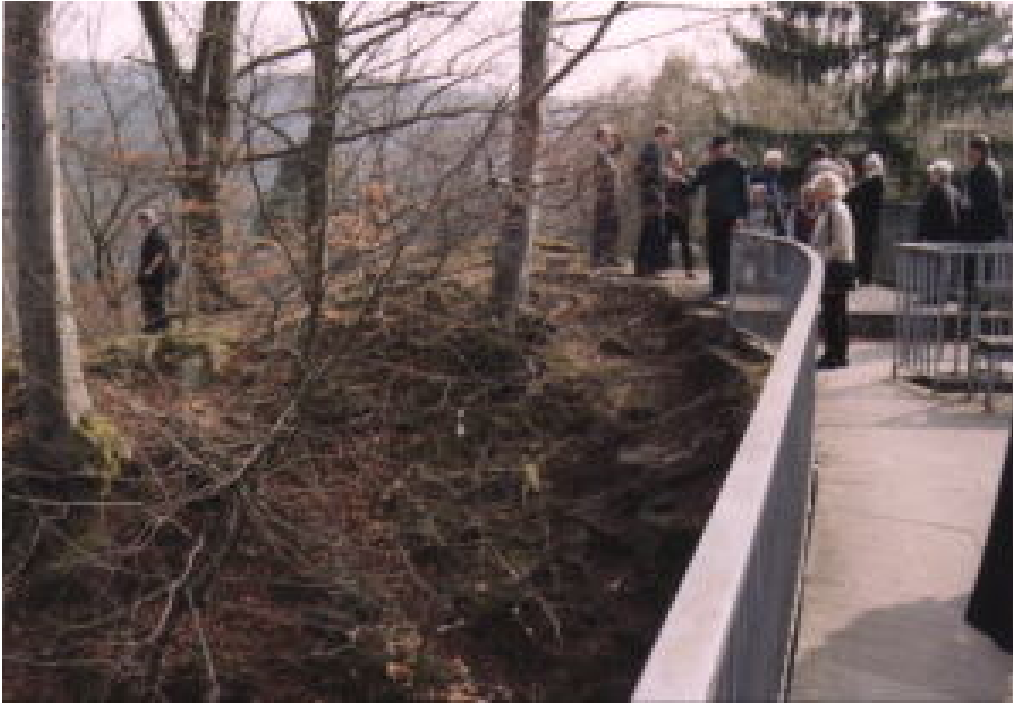
Burghügel neben der Schildmauer