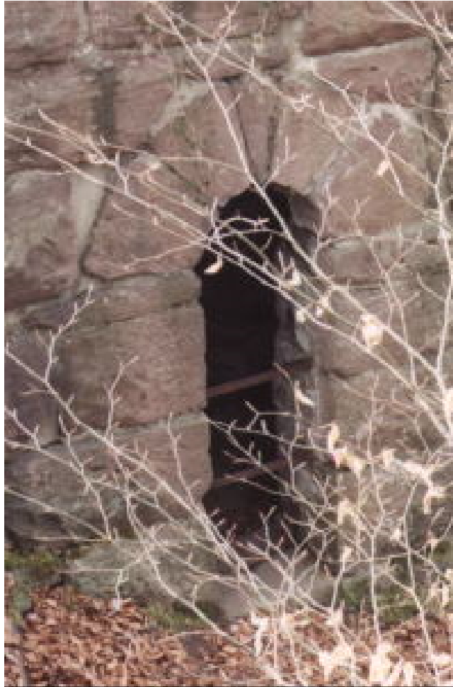
Schießkammer von der Burgseite gesehen