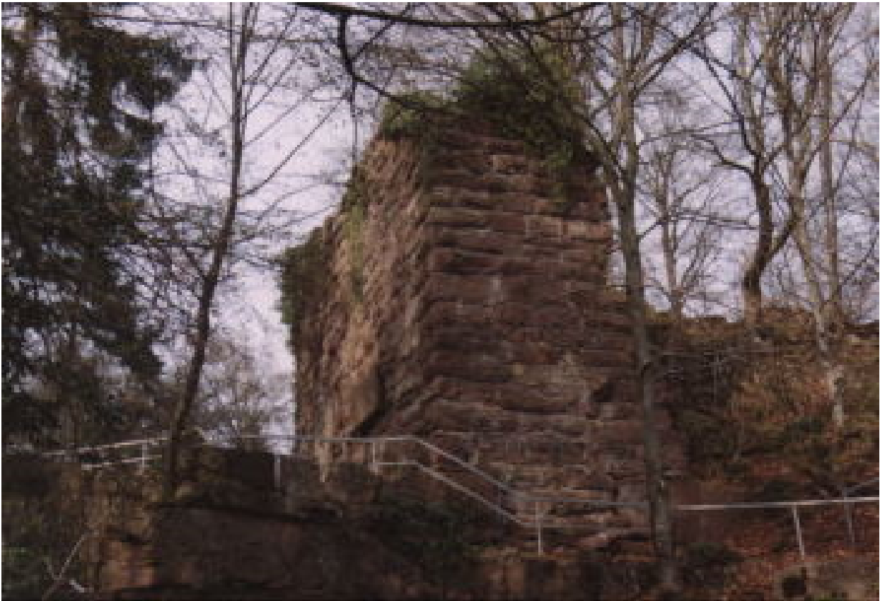
Schildmauer, links der Halsgraben