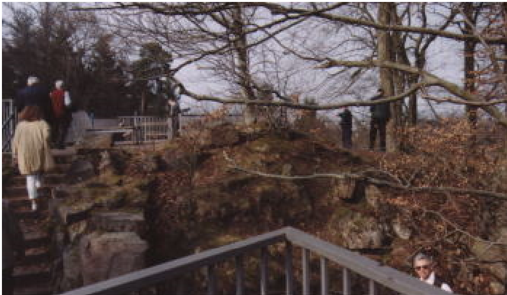
Begehbare Schildmauer, in der Mitte der Burghügel

Auf einem von der Nagold umflossenen bewaldeten Bergsporn befindet sich die Ruine Kräheneck über dem Ort Dillweissenstein 1 . Vom Ort aus kann man die vom Pforzheimer Bauingenieur und Burgenforscher im 19. Jahrhundert errichtete Nagoldbrücke zur Burg Dillweissenstein überqueren. Danach folgt einige hundert Meter weiter ein Aufstieg zur Spitze des Bergspornes und zur dortigen Ruine Kräheneck