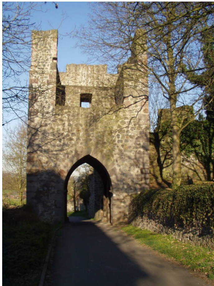
Torturm am südlichen Zwinger

Die Herren von Falkenstein errichteten den nördlichen gotischen Palas nach 1255/70, welcher ihren Namen trägt. Antonow vermutet einen Vorgängerbau an der Stelle des Falkensteiner Palas. Im Dreißigjährigen Krieg wurde die Burg zerstört