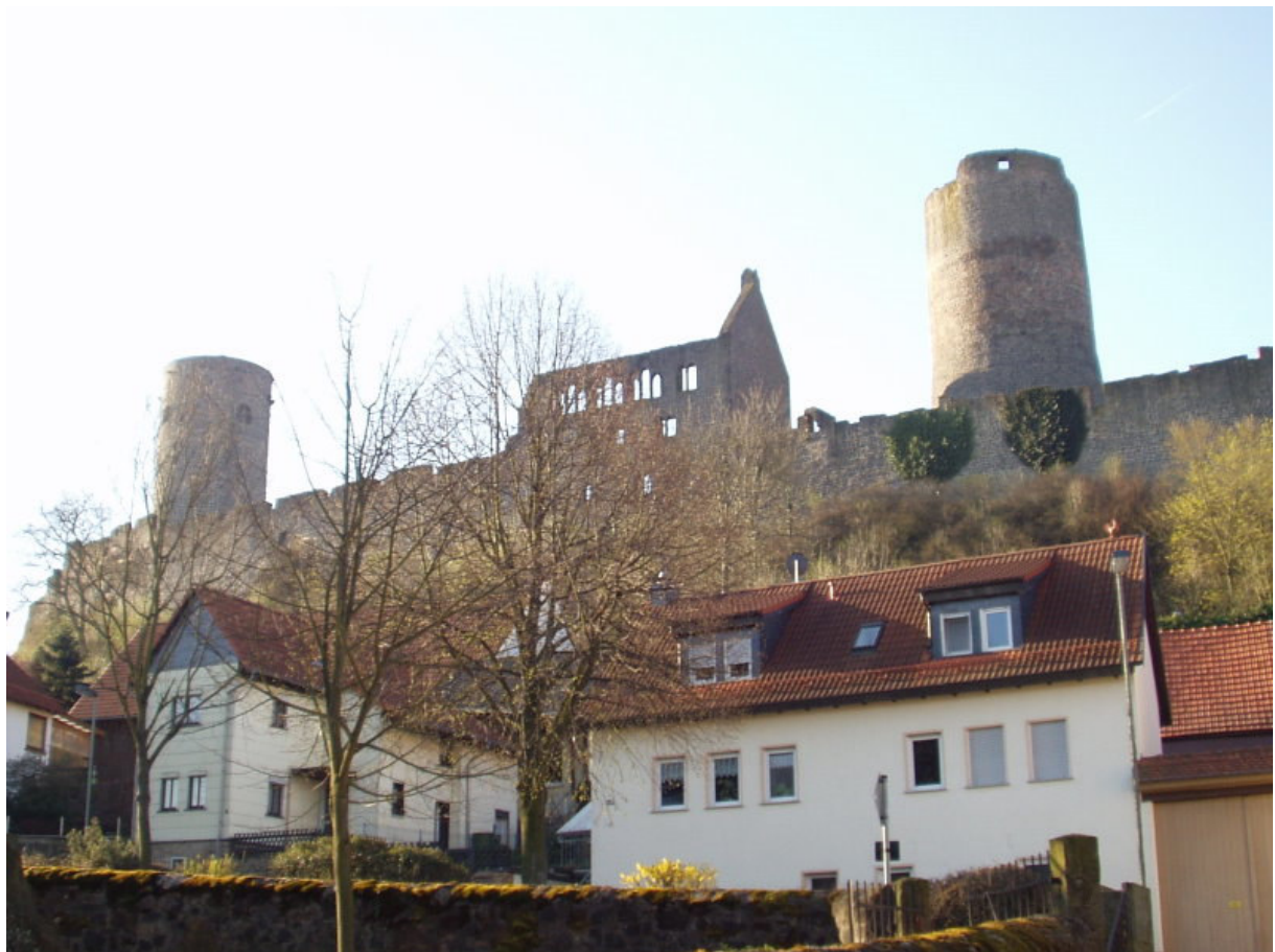
Burganlage von Norden

Wie ein Wahrzeichen erhebt sich die Burganlage zwischen den Autobahnen A5 und A 45 in der Nähe des Gambacher Kreuzes. Weithin sichtbar sind die beiden Rundtürme und beherrschen die umliegende Landschaft. Von Frankfurt und Gießen schnell zu erreichen, lohnt sich ein Besuch dieser außergewöhnlichen Anlage.