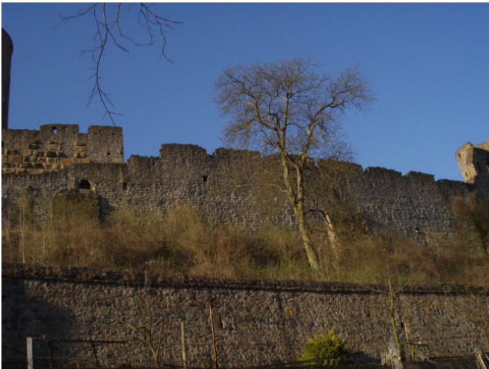
Südseite des ehemaligen romanischen Palas

Die Ringmauer selbst ist mit Buckelquadern verblendet, beachtenswert ist dort im Bereich der Wohngebäude die aufwändige Steinmetzkunst, sichtbar an den plastisch verzierten Fenstersäulen und –gewänden. Hotz beschreibt den südlichen Staufischen Palas sehr exakt, u.a. die kunstvollen Kapitelle 8 , die achteckige Galerie des Festsaaes, welche der Besucher vom FuÙe des Berges bewundern kann. Der Palas ist heute noch auf der Hofseite zweigeschossig. Dort sind u.a. noch säulengekuppelte Doppelfenster und eine Viererarkade sichtbar.