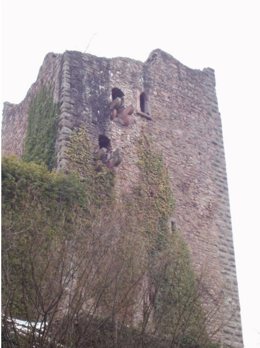
Südlicher Wohnturm von Norden