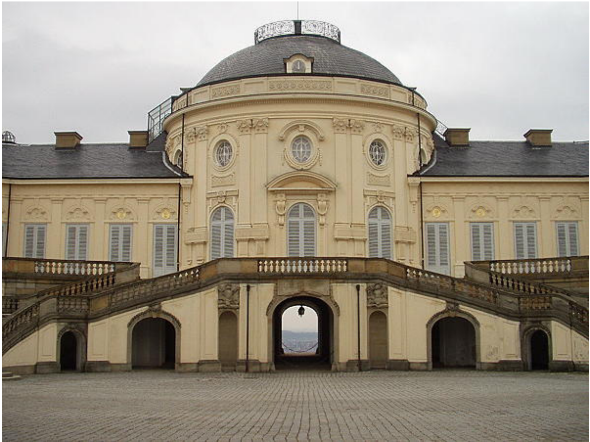
Schlossgebäude- die axiale Verbindung zum Schloss Ludwigsburg verläuft durch den rundbogigen Durchgang