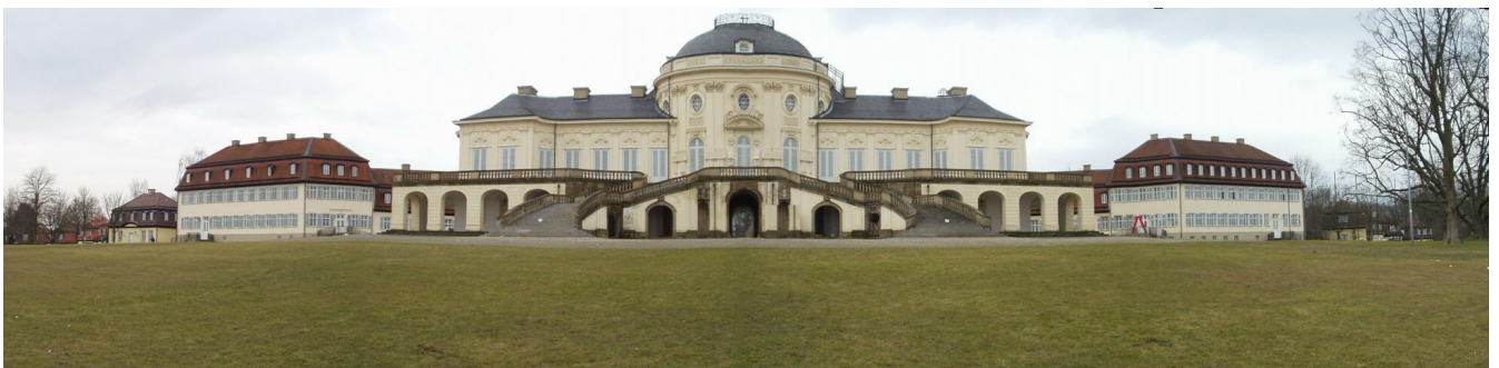
Solitude von Südwesten

Westlich von Stuttgart wurde das Schloss auf einer bewaldeten Anhöhe erbaut, welche weiter westlich mit dem Eichelberg verbunden ist. Ortsfremden ist sicher an dieser Stelle der "Eichelbergtunnel" der Autobahn A 81 ein Begriff. Die gut ausgeschilderte Anlage kann u.a. von der Autobahn A 81 erreicht werden in dem diese an der Ausfahrt 50 (Leonberg) verlassen wird. Folgt man den Schildern durch Leonberg auf die Anhöhe in Richtung Stuttgart zweigt hinter Gerlingen eine Straße nach Norden zum Schloss ab. Hier kann auf einem Waldparkplatz geparkt werden. Das Schloss erreicht man zu Fuß über eine Allee, welche zum Areal der Anlage führt.