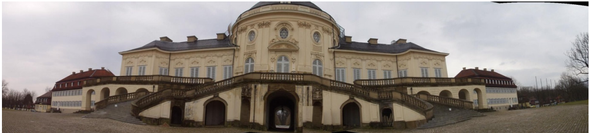
Solitude von der Talseite gesehen