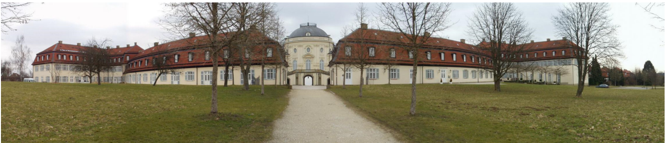
Nebengebäude- im Zentrum das Schlossgebäude

Beeindruckend ist die streng symmetrische Anordnung der Gesamtanlage welche einen weitläufigen Blick vom Rande des Bergplateaus über Stuttgart und Ludwigsburg ermöglicht. Zwei viertelkreisförmige "Kavalierbauten" hinter dem Schloss sowie weitere Nebengebäude mit schmucken Mansarddächern runden die optische Harmonie der Anlage ab. Einzig störend die neuzeitliche Villa des Ministerpräsidenten von Baden-Württemberg an der Allee zum Schloss, welche von einem Stacheldrahverhau und Schutzzäunen umgeben, sich nicht in das Gesamtbild einfügen möchte. Am Eindrucksvollsten jedoch wirkt auf den Besucher ein Blick vom Schlossgarten über die Solitudeallee, welche als Verlängerung der Anlagenachse als Schneise den Berg herunterführt und parallel zur Autobahn A 81 an Stuttgart vorbei bis zum Ludwigsburger Schloss führt. Der Eindruck entsteht, dass diese Schneise erst am fernen Horizont endet.