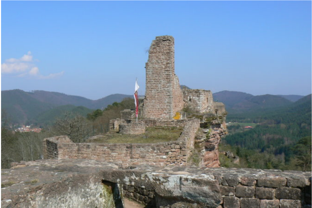
Blick vom westlichen Teil der Tanstein auf den östlichen Teil- im Hintergrund Grafendahn