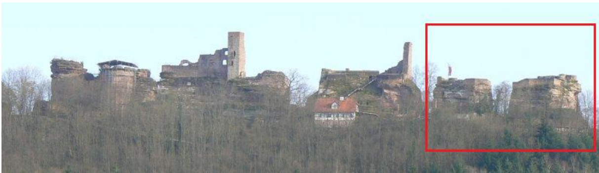
Blick von Norden

Mitten im Pfälzer Wald an der B427 zwischen Karlsruhe und Pirmasens liegt der Ort Dahn, welcher für seine Burgengruppe – den „Dahner Burgen“ bekannt ist. Die für Wanderer im Wasgau geeignete Umgebung wird auch „Dahner Felsenland“ genannt. Südöstlich von Dahn thront die Burgengruppe auf einem bewaldeten Höhenrücken. Der ca. 200 Meter lange und 30 Meter breite Felskamm wurde künstlich in drei Hauptteile und zwei Nebenteile zerlegt. 1 Auf ihnen befindet sich auf der Ostseite Altdahn . Im Mittelteil „ Grafendahn “ ( Grevendahn ) und auf dem Westteil „ Tanstein “ ( Dahnstein ). Wie auch die Pfälzer Burgen Fleckenstein und Drachenfels (siehe http://www.burgen-web.de/ ) gehört diese Burgengruppe zu den sogenannten „Felsenburgen“ 2