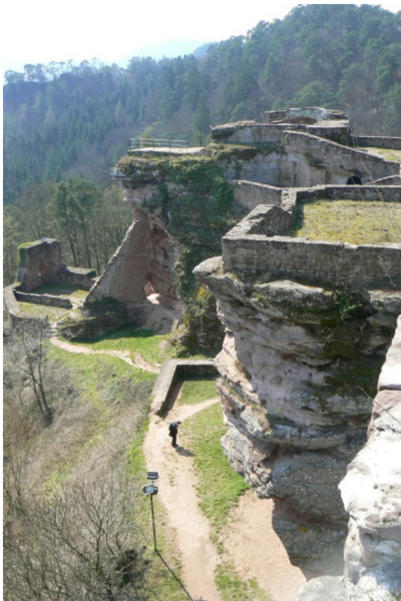
Rechts der östliche Felsen, dahinter der westliche Felsen der Tanstein, links hinten die Unterburg