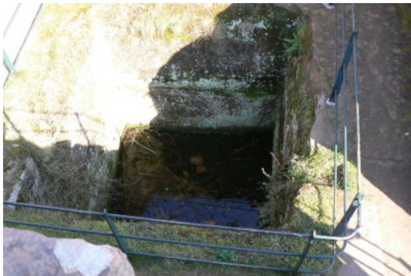
Zisterne auf dem Westfelsen

Die Burgengruppe wurden 1689 endgültig durch die französischen Truppen des Generals Melac zerstört.